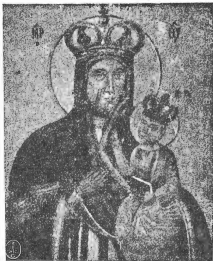
Образ Божої Матері Турковицької.