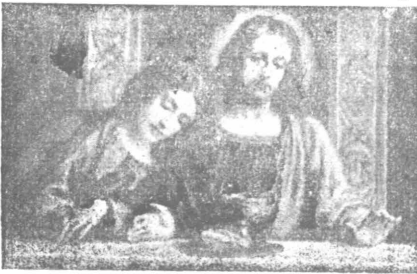
Тіло Христове, скріпи мене!

Кожна людина має свої праці, труди й терпіння. Але ці малі терпіння, що їх денно зазнаємо, Бог зсилає на нас зо своєї безмежної любови й доброти. Він zarazом додає нам сили зносити їх терпеливо, щоб тим способом улекшити нам страшні муки, що нас чекають по смерті в чистилищі.