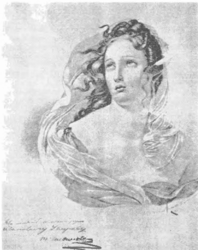
Це ранній малюнок Т. Шевченка 1830 року

самим портретом рукою Шевченка написано: "1830 года. Рисоваль Тарасъ Шевченко".