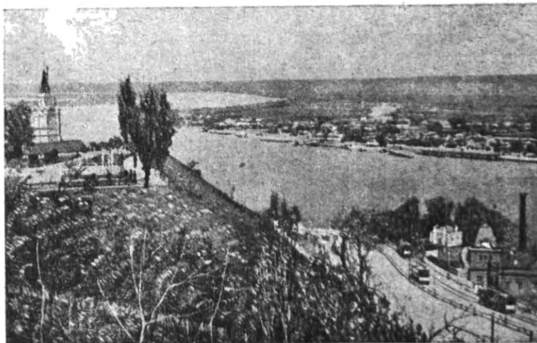
Київ. Вид на Поділ і Лівобережжя.