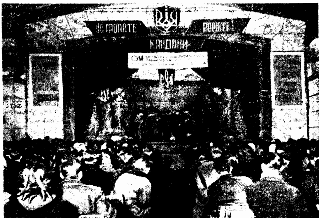
Сумівський драматичний гурток у Міттенвальді

В одній такій легенді говориться: «Коли настав останній час терпіння, коли вже вщерть наповнилася гнівом народна душа, а Симон Петлюра сидів за мішними ґратами, то його товариші принесли йому листа. В цьому листі був і малюнок коня. І от Симон вирізує з паперу того коня, приліплює на стіну своєї камери, коли доторкає рукою гриву — стіна розступасться, і він на своєму білому коні летить до рідних стрільців, що вже стоять готові до бою».