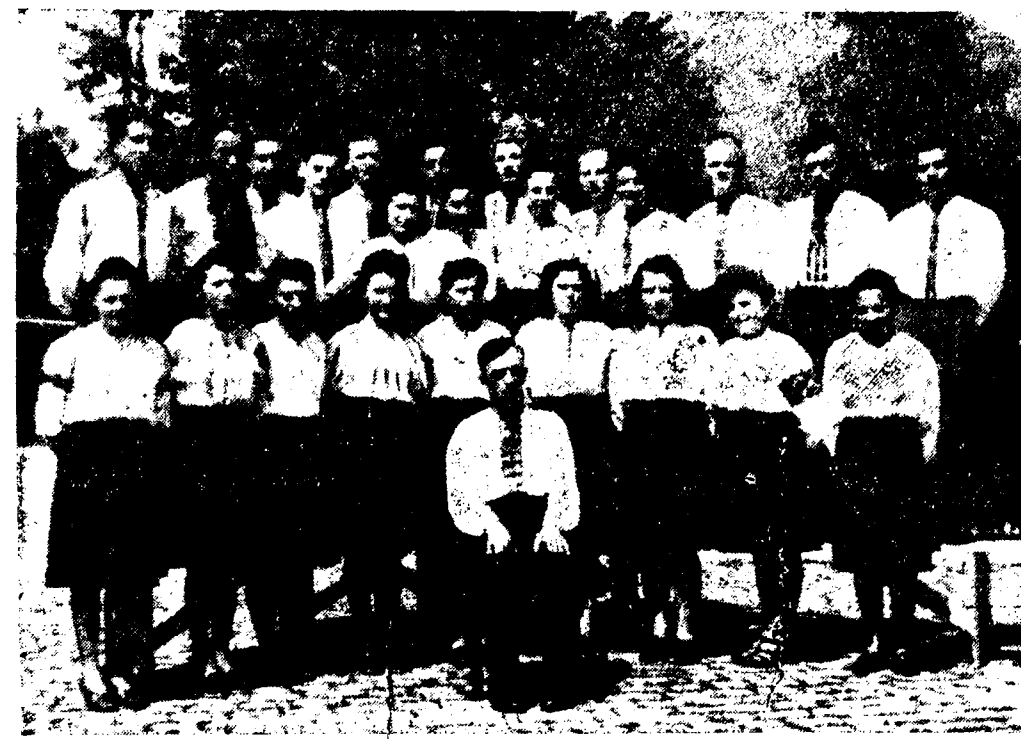
Сумівський хор в Берхтесгадені