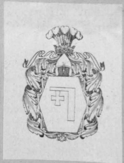
Сучасне знамено роду Сенюта-Сенютович, зголошене в Українській Родовідній Установі.