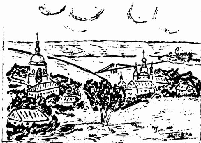
Видубецько-Михайлівський монастир в Києві /1906 р./

Чи ми ще зійдемося знову? Чи вже навіки розійшлись? І слово правди і любови В степи і дебрі рознесли? Нехай і так! Не наша мати, А довелось поважати! То воля Господа.