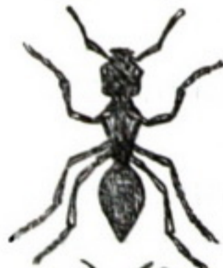
..... робоча мурашка.