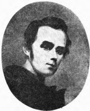
Taras Shevchenko, 1814—1861