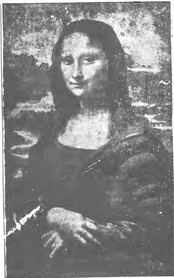
Мона Ліза — славний твір Леонарда да Вінчі