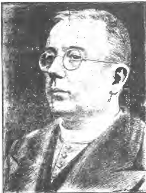
ПРЕЗИДЕНТ КАРПАТСЬКОЇ УКРАЇНИ сл. п. монсьйор д-р Августин Волошин .