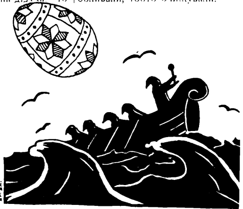
Еліяшевська Христиня — "Гамалія" (туш)