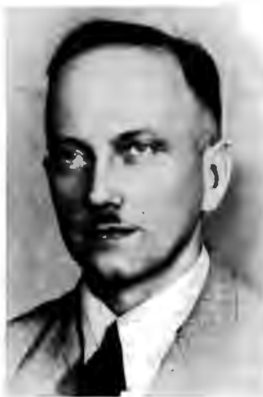
Д-р Юрій Іванович ЛИПА (1900—1944)