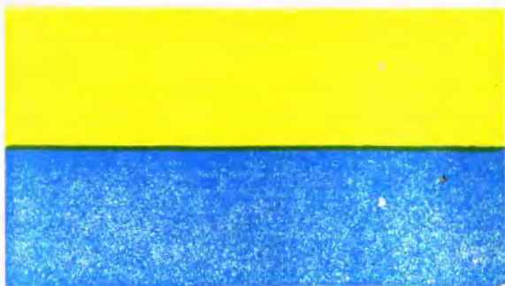
ЖОВТОБЛАКИТНИЙ ПРАПОР УКРАЇНИ