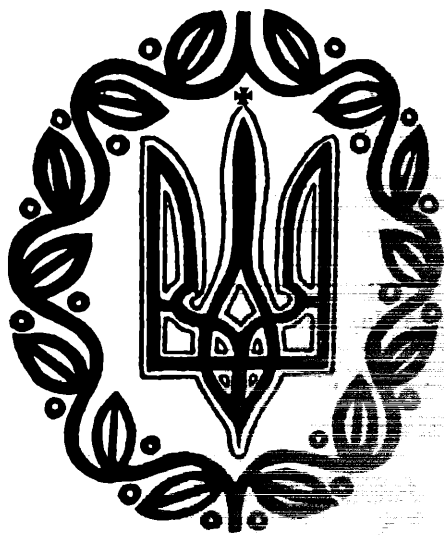
Державний знак України — Тризуб св. Володимира.