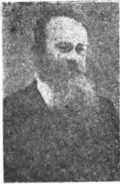
Проф. Михайло Грушевський, голова Української Центральної Ради.

Але для того, щоб ні Російське Правительство, ні яке інше не ставали Україні на перешкоді уста-