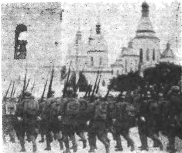
Фрагмент дефіляди українських військ на Софійській площі.

... „Від нині Україна стає Українською Народньою Республікою” ... слова III Універсалу, проголошеного 7 (ст. ст.) листопаду 1917 р.