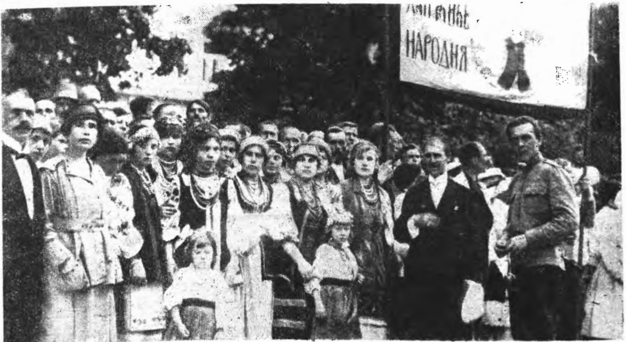
Кияни приглядаються до військової паради на Софійській площі.

... „Прямуючи до автономного ладу на Україні, Центральна Рада в згоді з національними меншостями України, підготовлятиме проекти законів про автономний устрій України“ ... слова II Універсалу, проголошеного 3 (ст. ст.) липня 1917 р.