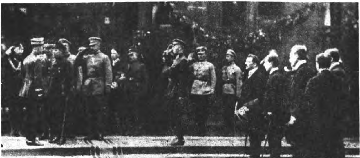
Остання спроба відновити українську державність (гол. отаман С. Петлюра відбирає рапорт від пол. ген. Ридза-Сміглого на київській двірці в травні 1920 р.).