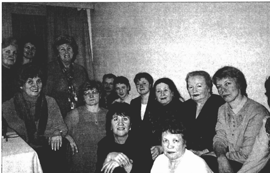
Setkání v Praze s představiteli Svazu Ukrajinek Estonska