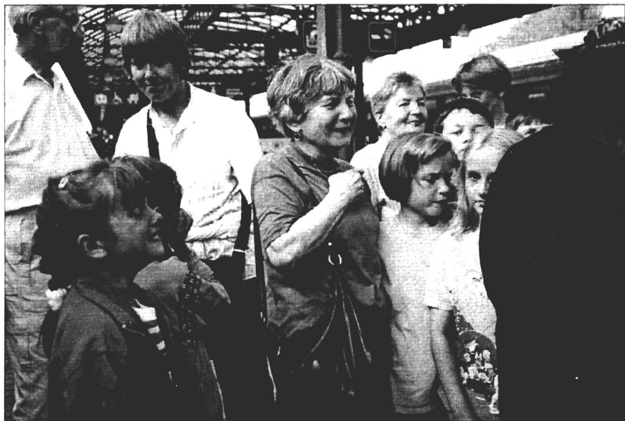
Loučení s dětmi na nádraží