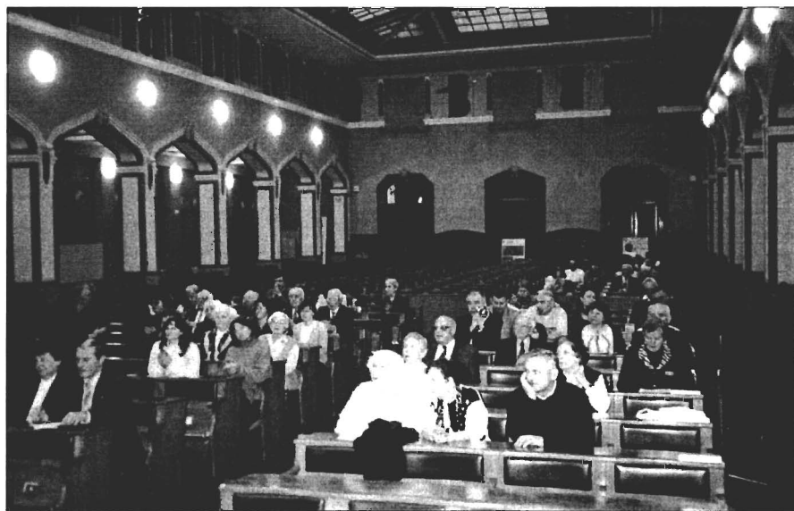
Uctění Dne paměti hladomoru uměle vytvořeného bolševickou mocí na Ukrajině v letech 1932–1933