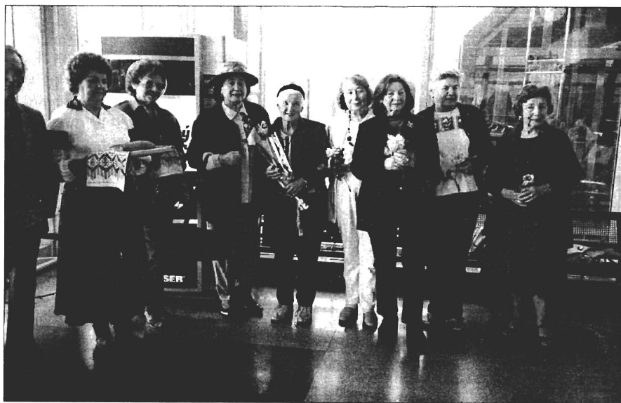
Sdružení Ukrajinek České republiky srdečně vítá chlebem a solí účastníky regionální evropské konference Světové federace žen (SFSŽ) na Ruzyněském letišti