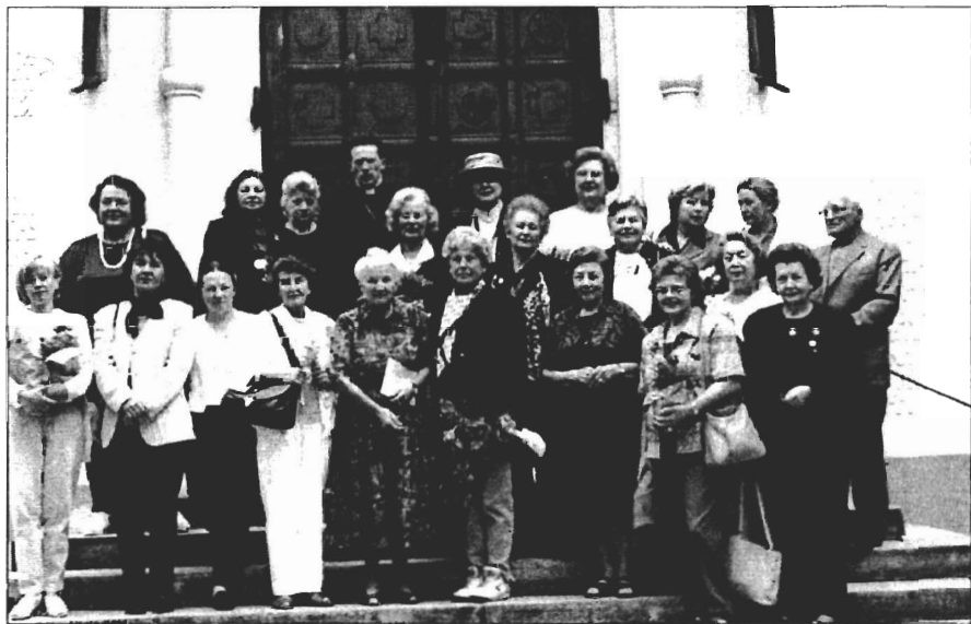
Účastníci konference SFSŽ navštívili památná místa Prahy a také Olšanské hřbitovy, kde odpočívá řada významných ukrajinských vědců, spisovatelů a politiků