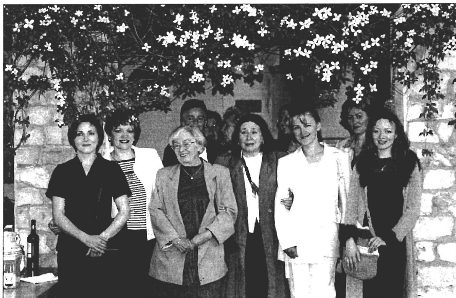
Slavíme Den matek