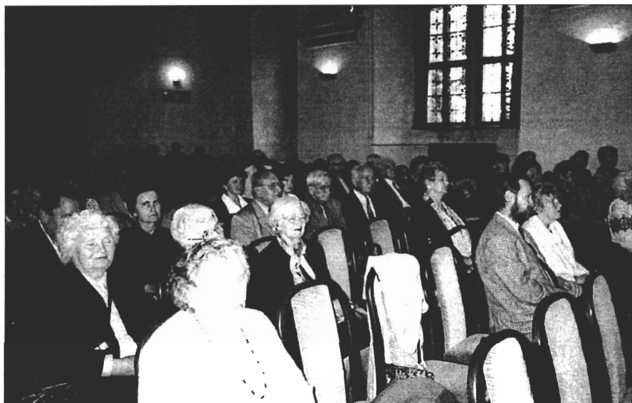
Účastníci setkání, věnovaného 187. výročí narození Tarase Ševčenka