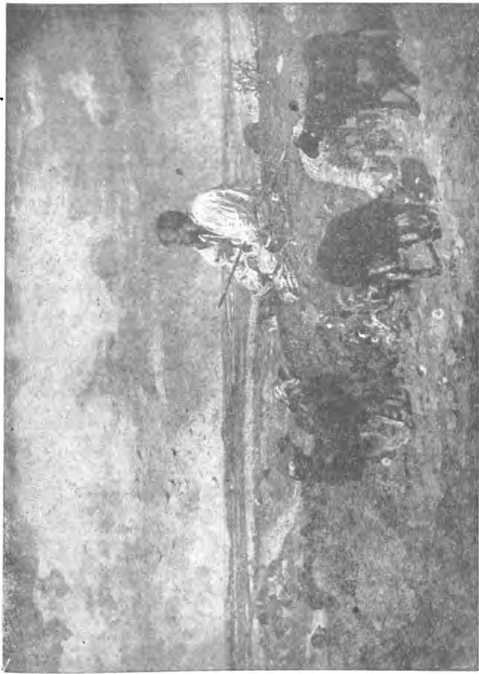
„Мені тринадцятий минуло..”