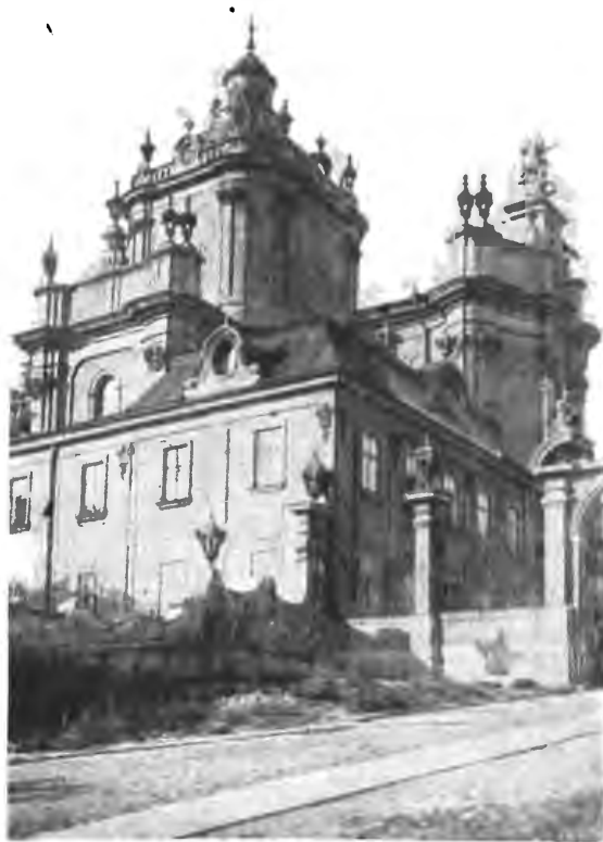
Катедра «Св. Юра» у Львові

Бадьорий марш із голосників табору скитальців, що розлягся в долині — збудив отця Юрія з задуми. Пригадав, що час додому. Треба було з жалем лишати самотню алею устелену червонозолотим намистом на честь Царя-Листопада й йти туди в гамір табору до щоденних занять. Йдучи повільною ходою в напрямі табору глянув на обрій і здавалося отцю Юрієві, що клаптиками блакиту неба, окутаного в білі, немов волосся старця, хмари, глядять на нього Великий Митрополит. Отець Юрій випрямився і твердим кроком лицаря прямував на зустріч, зачатій ним перед двадцятьма роками, невиспущій праці: кування характерів юних пластових поколінь.