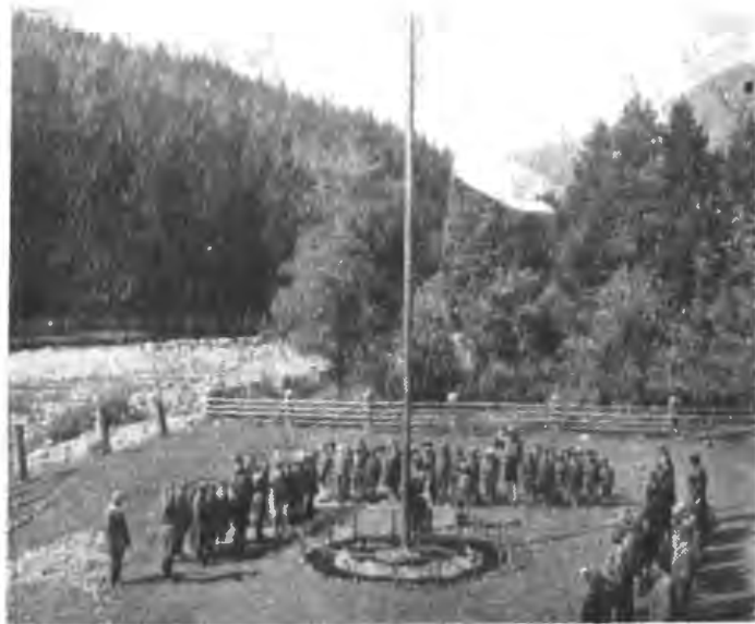
Піднесення прапору »в Таборі Новаків« в Підлютім 1930 р.

„Так е!” виструнився Юрко й подумав „буду добре уважати” й ще заки облягло пластоє братство входіві двері — він уже стояв коло них та мовчки глядів на гурт жвавих юнаків, що ждали нетерпеливо на появу кир Андрея.