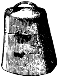
Дзвін Св. Патрика (V в.).

Дерев'яне било в греків робилося з явора ( αἰθέραμος ) і було двох родів: велике ( τῆμαντρον μέγα ) й мале ( τῆμαντρον μικρόν ). Перше звичайно висіло, а останнє було ручним; його, коли стукали в нього, держали в руках і ходили з ним з місця на місце. Мале било виявляло з себе дерев'яну, гладенько обтесану дошку, метрів два-три завдовжки, пальців чотири-пять завширшки й пальців два-три завтовшки; посередині воно було звужене, щоб зручно держати в руці. По краях дошка була трохи тонша й мала по дві-три дірочки для того, щоб звук був ліпшим. Велике било ( τῆμαντρον μέγα або коротше— τὸ μέγα )—дерев'яна дошка в два, а то й більше, метрів довжини, до метра завширшки й товщиною нашої звичайної дошки, добре обтесаної. Велике било завжди висіло. В нього, як і в мале, били дерев'яними молотками. Що-до била метальового, або клепала, то воно представляло залізну ( τὸ σιδηροῦν ) або мідну ( τὸ χαλκοῦν ) штабу, зігнуту в дугу; вона мала метра півтора завдовжки, п'ять-шість пальців завширшки й три-пять сантиметрів завтовшки. Метальове било (клепало) завжди висіло. В грецьких монастирях звичайно знаходимо всі три оці била, в церквах же парохіальних—бачимо переважно велике дерев'яне било 3) . Наші паломники та взагалі мандрівники