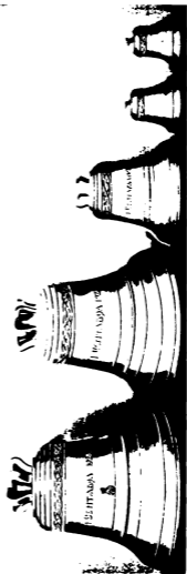
Дзвони, одляні в Польщі для Японської Православної Церкви.

На при кінці цього короткого нарису не зайвим буде згадати ще про п'ять дзвонів, які, хоч і з'явилися тільки в 1929 р., а проте мають вже історичне значіння. Мова йде про ті дзвони, що послано від імени Православної Церкви в Речі Посполитій Польській до православного собору в Токіо й, таким чином, являються даром першої Церкви для Православної Церкви в Японії. В 1925 р., підчас землетрусу в Токіо, згорів тамошній православний собор. За матеріальною допомогою Європейських Православних Церков собор було поновлено, й 15 грудня 1929 р. відбулося урочисте його посвячення, в присутності трьохтисячного зібрання народу (95% присутніх творили православні японці), міністра народньої освіти в Японії, представників громадських організацій. Ось для цього собору, згідно з постановою Св. Синода Православної Церкви в Польщі, було переведено по всіх храмах одноразову збірку грошей, яка й дала до 7 тисяч злотих. На зазначену суму було зроблено й вислано до Японії п'ять дзвонів, вагою в 466, 129, 62, 33 і 22½ клгр. В Токіо їх повішено на дзвіницю, й вони там скликають на церковні відправи православних христیان-японців.