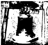
Дзвін з катедри Св. Юра у Львові, 1341 року.

Звичай робити написи на дзвонах був дуже розповсюджений на заході. Вже Алкуїн, сучасник Карла Великого, говорить про існування цього звичаю за його часу. Разом з тим був розповсюджений звичай давати власні імена поодиноким дзвонам, найчастіше — імена святих. Надаванням імени дзвоніві малося на меті відрізнити посвячений дзвон од непосвяченого (хоч в латинському понтифікалі чин посвячення дзвону не сполучається з порядком надання йому імени), оддати його під захист та опіку якогось святого і, що найголовніше, підкреслити, що до церкви кличе не дзвін, а той святий, ім'я якого надано дзвоніві.