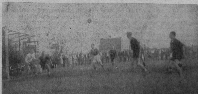
Зі змагань Лев — Черногора. (Під воротами Льва). Світ. Квас

Гадина песимізму звиває своє кубло найрадше в хворому тілі