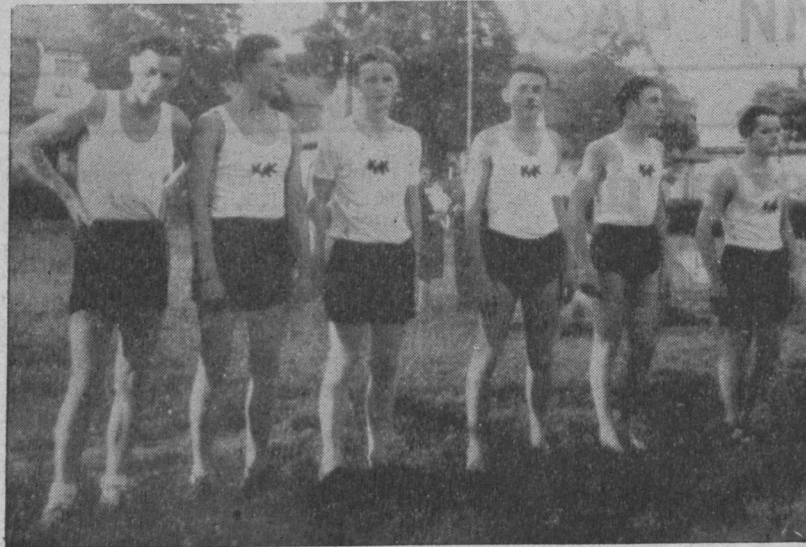
Легко-атлети КЛК, Бісенгофен

ня), щораз то більше людей лисих, щораз то більше людей хворих на шлунки, нирки, легені і т. д. Сидять бюрове життя обнижує температуру цілого людського організму, а це має в своєму наслідку недеспозиції шлунка, нежити, і т. д. Причини помітного послаблення розрідної спроможности у великих індустріальних