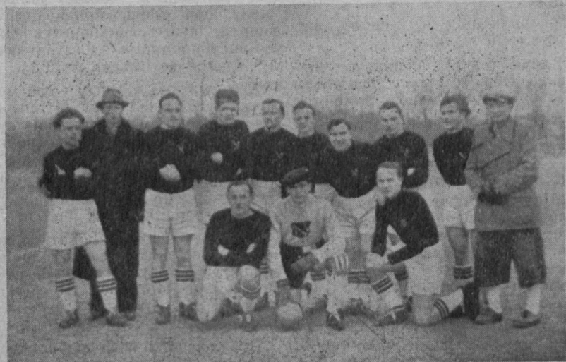
ФК „Україна“ на еміграції

грецько-альбанських сутичок, гноблення греками меншин у Македонії і Зах. Тракії, в чому — як твердить мін. Мануїльський у своїй скарзі до генерального секретаря Об'єднаних Націй — винуваті англійські війська, які ще досі перебувають у Греції і підтримують політику теперішнього „монархістичного“ грецького уряду. Тимчасом Альбанія — як заявив її представник у Парижі прем. Годжа журналістам — не бажає собі нічого більше, лишень залишити його країну у спокою. Зате грецький прем'єр Теал-