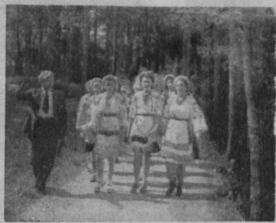
Ідуть на площу

Реґенсбург 9. 8. ц. р. Змагання копаного м'яча, за першенство області Реґенсбург між дружинами: „Буревій“, Ноймаркт і „Січ“, Реґенсбург дали вислід 1:0 (0:0). Суддював дуже добре п. Андрухович.