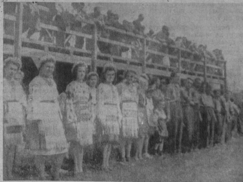
Після свого виступу — приглядаються іншим

Це буде найкращим привітом Рідній Землі.