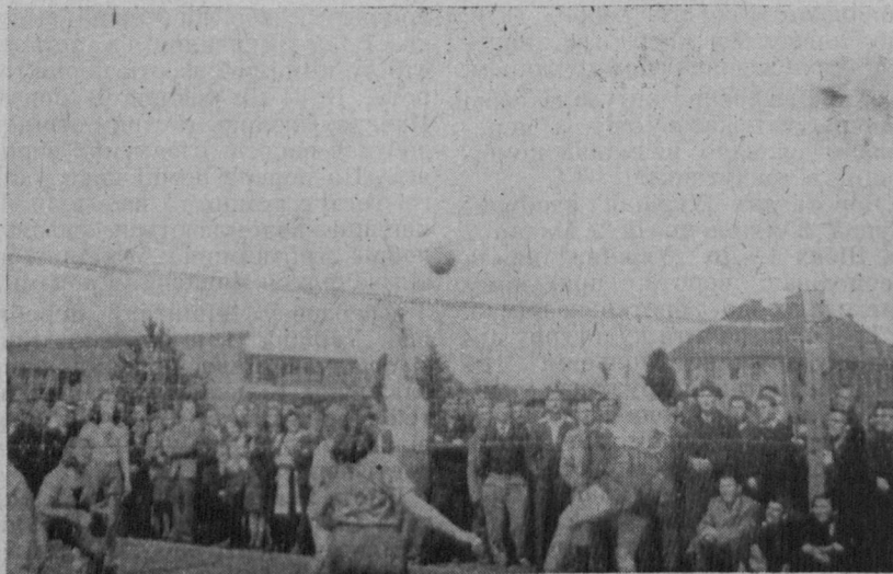
Глядачі зацікавлені: відіб'є, чи не відіб'є?..

У зв'язку з подіями в Палестині англійський уряд скликав на 23. вересня ц. р. конференцію до Лондону. Англія пропонує поділити Палестину на чотири автономні округи: жидівську, арабську з Єрусалимом і Неджаб під проводом спільного федерального уряду. Чи араби візьмуть участь у конференції — невідомо.