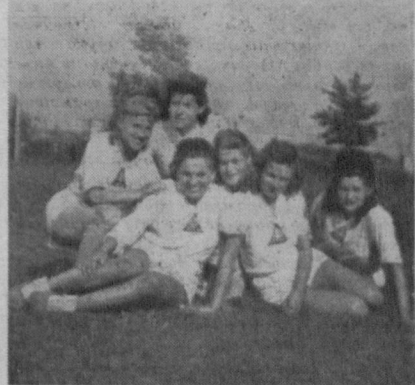
Відбиванка УССК. Жіноча дружина

Змагання почалися в суботу 27. 7. ц. р. між „Дніпром“, Бамберг і „Січ“, Регенсбург. Вислід 27:22 (18:15). Гра вирівняна з легкою перевагою „Дніпра“ в другій половині. (Судували лотіші). Наступні змагання відбулися в неділю 28. 7. ц. р. між „Дніпро“, Бамберг і „Лев“, Міттенвальд. Вислід 15:16 (3:11) для „Льва“. — Гра на низькому поземі. Вирішальні змагання відбулися того само дня вечером, між „Січ“, Регенсбург і „Лев“, Міттенвальд з вислідом 18:1 (9:0) для „Січі“. Першенство амер. зони здобула „Січ“, Регенсбург, друге місце „Дніпро“, Бамберг, третє „Лев“, Міттенвальд.