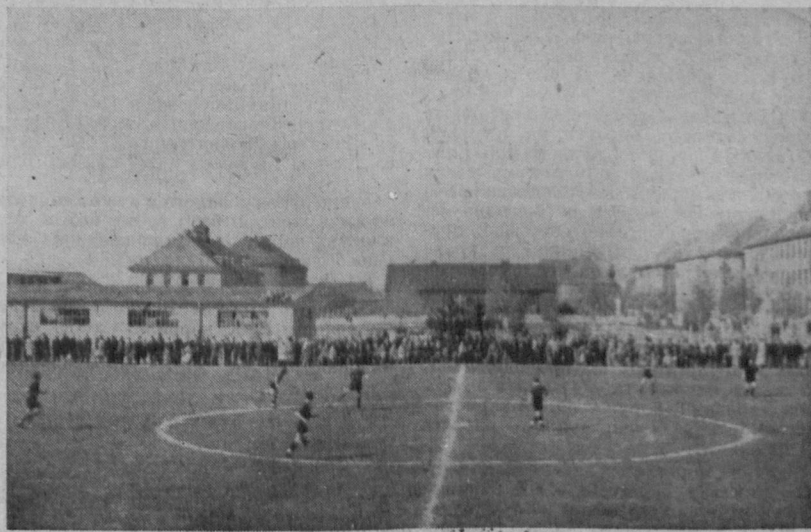
На спортивній таборній площі