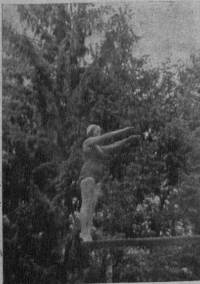
За хвилину скочить у воду