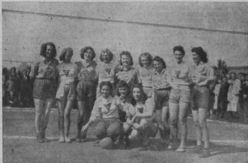
Смерічки з „Чорногори“ і львиці з „Льва“