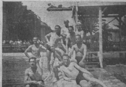
Після води — сонце

Повітря найкраще, найкорисніше, найбільше в окис, а найменше занечичене трійливими газами — є над рікою, де повно зелені. Пливач віддыхає таким повітрям, коли, напр. наколесник іде по шосі повній куряви, в поставі із стисненою трудною кліткою, дотого працюють у нього майже виключно тільки ноги, коли у пливача — і рамена і м'язи тулуба, і шиї, словом пливач має рух найбільш корисний і найбільш всесторонній.