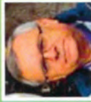
МИРОСЛАВ ІВАНІК: «Оцінка спадщини Української Повстанської Армії»