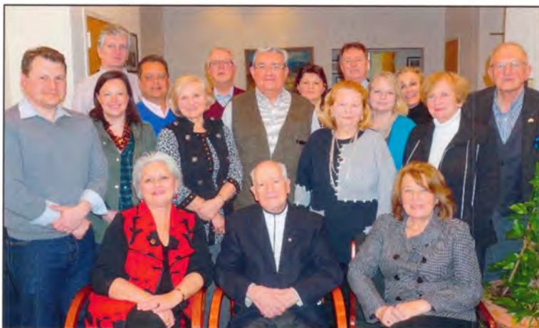
Учасники основоположних зборів Крайового Всегромадського Комітету

70-ліття депортаційної акції «Вісла» 70-ліття Великого Рейду УПА на Захід