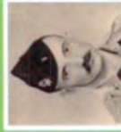
ПЕТРО СОДОЛЬ: Великий рейд УПА та його вплив на Західний світ