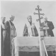
Посвячення Площі під Будову Катедрі. Акт освячення довершено Вірною Владикою Мстиславом 7-го травня, 1950 року.