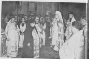
По Нареченні Митрополит Іларіон сповідає Духовенство й народ, що Обранцем Собору прийняв обрання.