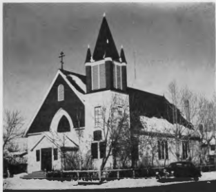
Перша Українська Православна Церква Громади Святого Івана Хрестителя в Едмонтоні під адресою 10001 - 96 вулиця. Закуплено її в осень, 1926 року.