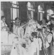
Перша Візитація Ворреск, Владика Андрей в Катедрі Святого Івана в день Храмового Світа, 7-го липня, 1959.

Підчас Концерту Владика Митрополит виголосив промову-виступ на тему: "Митрополит-Мученик Арсеній Мацієвич".