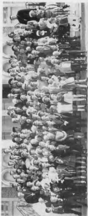
Святлана прадставіла месыяні класу Недаіона Школа при Катедры з ім. Парославі та універсітэтам.