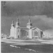
Зовнішній вигляд Катедрі зараз по закінченні її будови, 1952.