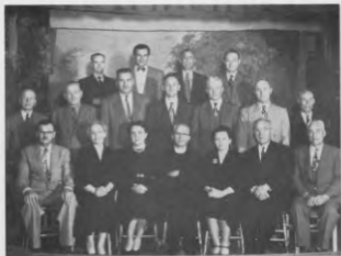
Члени Засідки Громади Св. Івана в роках 1970 - 71 - 72.