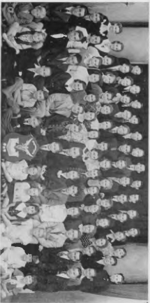
Морозова Организация СУМК била в менингъ поканени в гонях ПСС-Иван. Блато СУМК иже итали Грочане била трасовани. Блато в иже Сумкина твир забавати сполити гонл сирпа саморе грочанства.