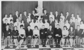
СТАРШИЯ ВІДДІЛ СУМК ПРИ КАТЕРДІ В 1963 РОШІ