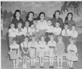
Дитячий Садок в 1903 році при Катедрі Св. Івана в Едмонтоні.