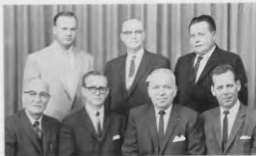
УПРАВА ВІДДІЛУ Т.У.С. ПРИ КАТЕДРІ

Нас можуть запитати: Яке ж ставлення ТУС до УГПЦ в Канаді? — Відповідь на це питання беремо з останнього статуту ТУС, що був затвержений на загальному з'їзді СУС в 1960 році, з розділу: Цілі й обов'язки — літера "в" де сказано: