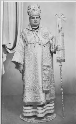
ВПРЕОСВЯЩЕННИШИИ ВЛАДИКА АНДРЕИ Архископ Едмонтону і Західноі Канади