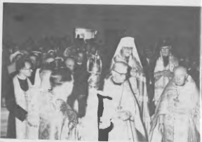
Початок Наречення. Старші Святенки о. Протопресвітер С. Савлук і о. Митрополит Святослав ідуть у Вінтар за Обранцем Собору.