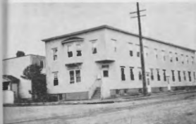
Інститут ім. Михайла Грушевського (тепер Св. Івана) в залі якого відбувались перші Богослуження.