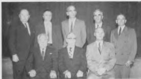
Заряд 15-го Відділу Взаїмної Помічі.

З нагоди 40-літнього Ювілею Катедральної Громади Св. Івана, 15-тий Відділ Взаїмної Помічі сердечно дякує Громаді за чисельні вияви їхньої кооперації з Відділом і складає Громаді щироші побажання успіхів в майбутньому на Славу Божу та на користь всієї Української Православної спільноти в Канаді.