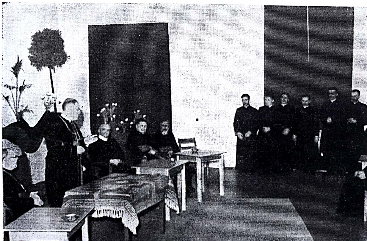
1949 р. : Хіротонія нових українських католицьких Єреїв Ordination des nouveaux prêtres catholiques ukrainiens