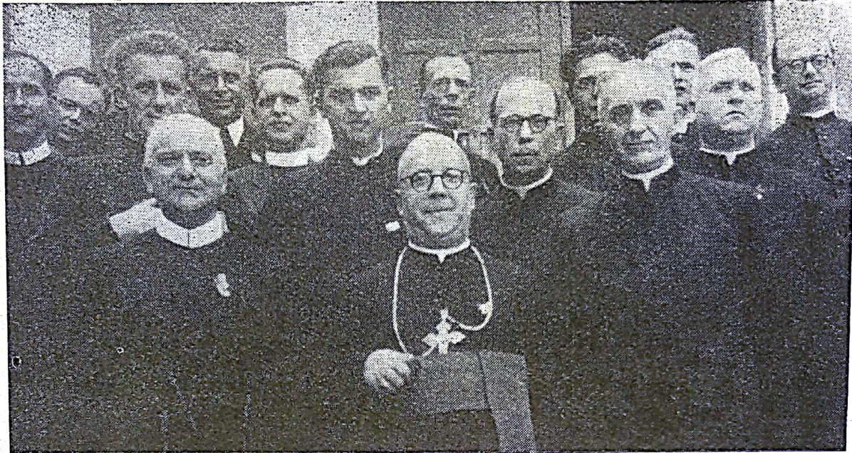
В першому ряду: Їх Ексц. ВПРЕОСВ. КИР ІВАН БУЧКО. Побіч Генеральні Вікарії: Впр. О. М. Ван де Малє, Ч.Н.І., і Всеч. О. Голинський.

На день 20 жовтня 1949 року припадають 20-ті роковини єпископських свячень Їх Ексцеленції Преосвященного Кир Івана Бучка, Апостольського Візитатора для українців в Західній Європі. З нагоди цього великого Ювілею з усіх сторін, де перебувають українці на скитальщині і еміграції плинуть в сторону Улюбленого Преосвященного найсердечніші побажання, а до Престолу Всевишнього горячі молитви, щоб Всевишній дав їм Великому Опікунові і Духовному Провідникові, многих і благих літ, здоровля і сил для дальшої праці і проводу на славу Богові, Католицькій Церкві та на добро українського народу.