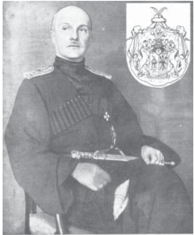
Павло Скоропадський Гетьман усієї України-Руси, козацьких військ та державного флоту, 1917-1920 рр.

І досвід історії дійсно підтвердив, що нації, де переважають "неутральні" чи то у внутрішній, чи то в зовнішній боротьбі, неминуче засуджені на смерть і на рабство. Боязливе полювання у внутрішній боротьбі на чужу перемогу робить