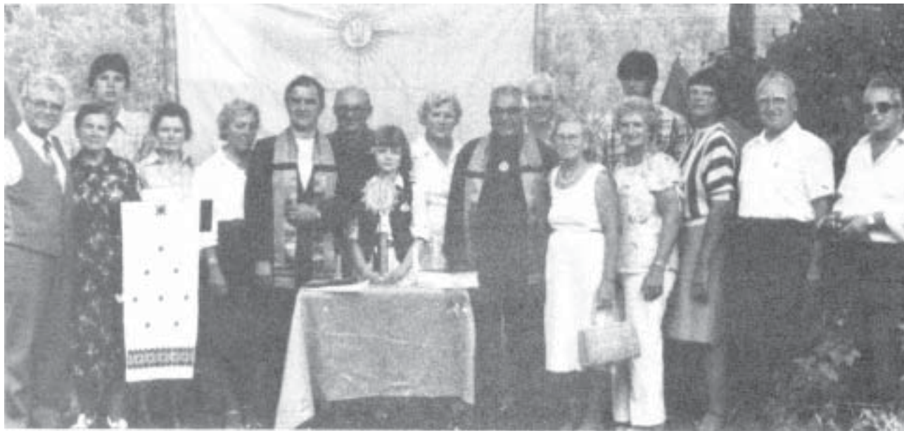
Станиця "Канів", Канада. Свято Купала, 1983 року.

Сьогодні його вже нема серед нас. Він відійшов в Зоряне Царство Духа Предків, але світла пам'ять про нашого славного побратима завжди з нами.