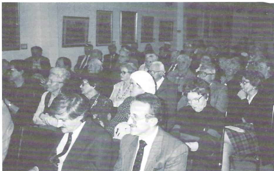
Присутні на Інформаційному Вечорі Осередку минулого листопада.

Members had the opportunity to obtain the latest information about our two principal projects at an Information Night held on November 23, 1992. The projects were described by their respective coordinators, after which three participants described their work and experiences in Ukraine.