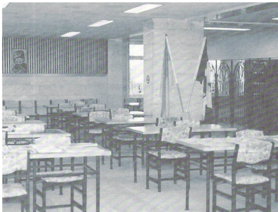
Вид на читальню сьогодні. На столах українські газети і журнали із заходу.

Добре попрацювали для створення українського центру активісти Луганського Руху.