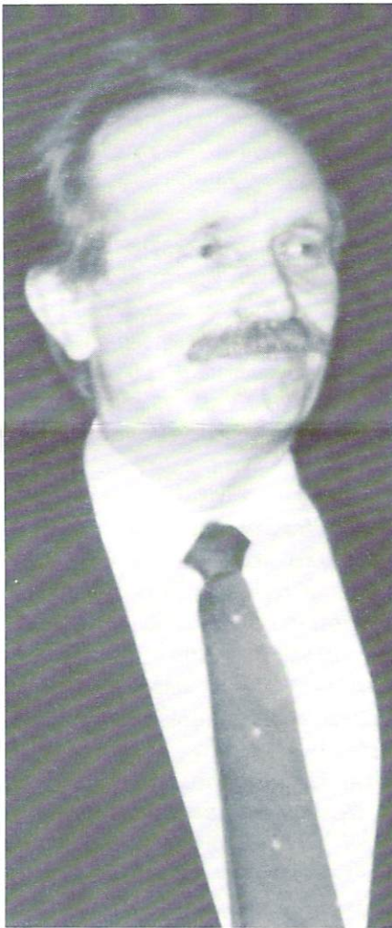
Депутат В'ячеслав Чорновіл, Голова Народного Руху України, буде гостем на Вечері Зустрічі з Торонтським Осередком 7-го березня, 1993 р.

В березні до Канади приїжджає голова Народного Руху України і Депутат Верховної Ради В'ячеслав Чорновіл. Наш осередок організує вечерю-зустріч із Паном Чорноволом, 7-го березня ц.р. в 5-тій год. пополудні в Українському Культурному Центрі при 85 Christie St. Квитки можна придбати в нашій бюрі, від членів ексекютиви як теж в книгарні Арка Захід і Арка-Queen. Це буде його самотнім публічним виступом перед Торонтською графдою.