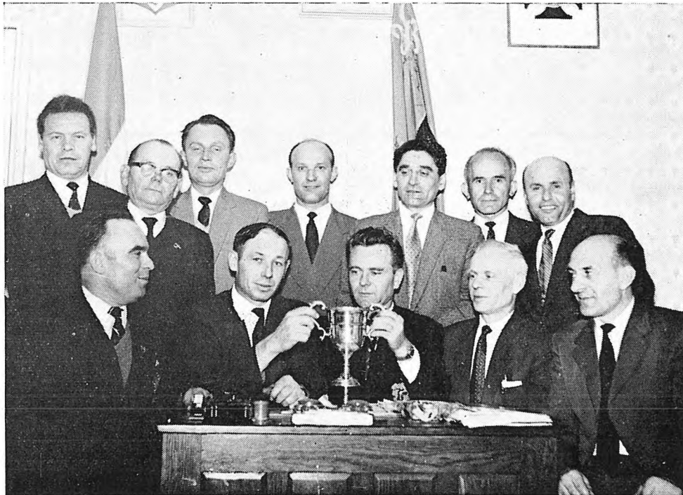
Відділ ОБВУ — Брандфорд одержав чашу в нагороду за взірцеву працю