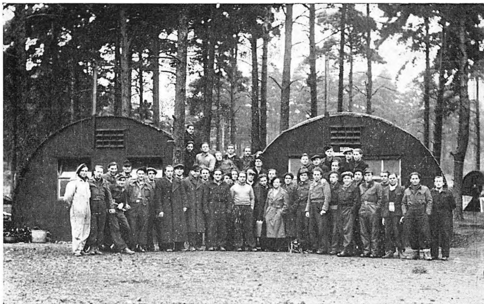
Бувші вояки в робітничому таборі Бордон в 1949 р.

Виглядає на те, що кожний, який прочитає вищеподану статтю, повинен мати ясний образ дійсності в Советському Союзі, з яким чи тепер, чи пізніше, Заходові доведеться воювати. Стаття має важливість ще й тому, що вона яскраво вказує на Україну як колонію Москви, розкриваючи всі колоніальні експерименти, переводжувані Москвою в Україні під облудною димовою завісою із виписаним на ній брехливим гаслом, що Москва — це борець «за волю колоніальних народів».