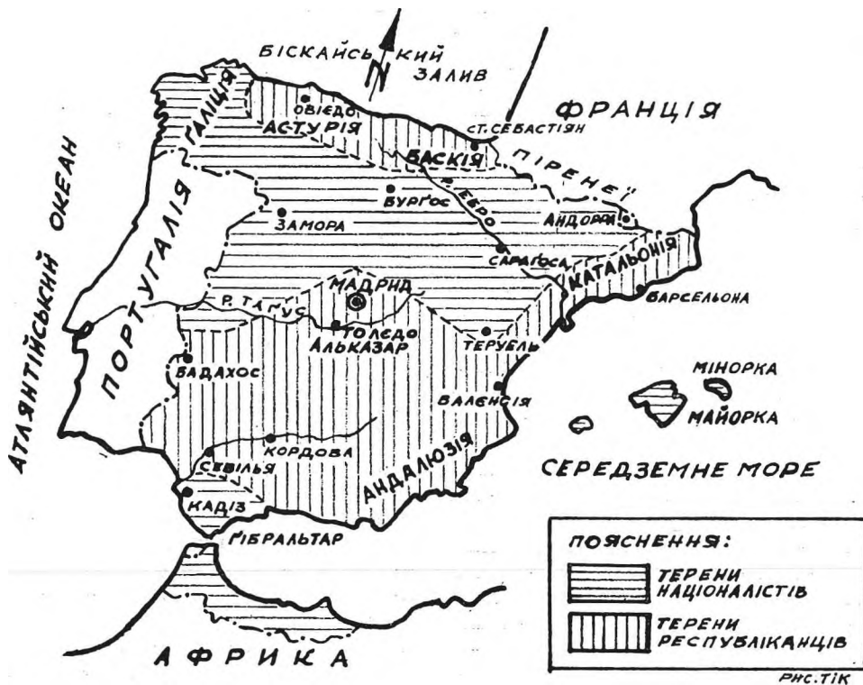
Іспанія — стан у липні 1936 р.

Номінально операціями республіканської сторони керувало міністерство війни в Мадриді. Воно складалося з регулярних старшин та генералів, які залишилися льяольні республіканцям. Міністром війни спочатку був генерал Кастельо, але він збожеволів від вістки про смерть брата, забитого анархістами.