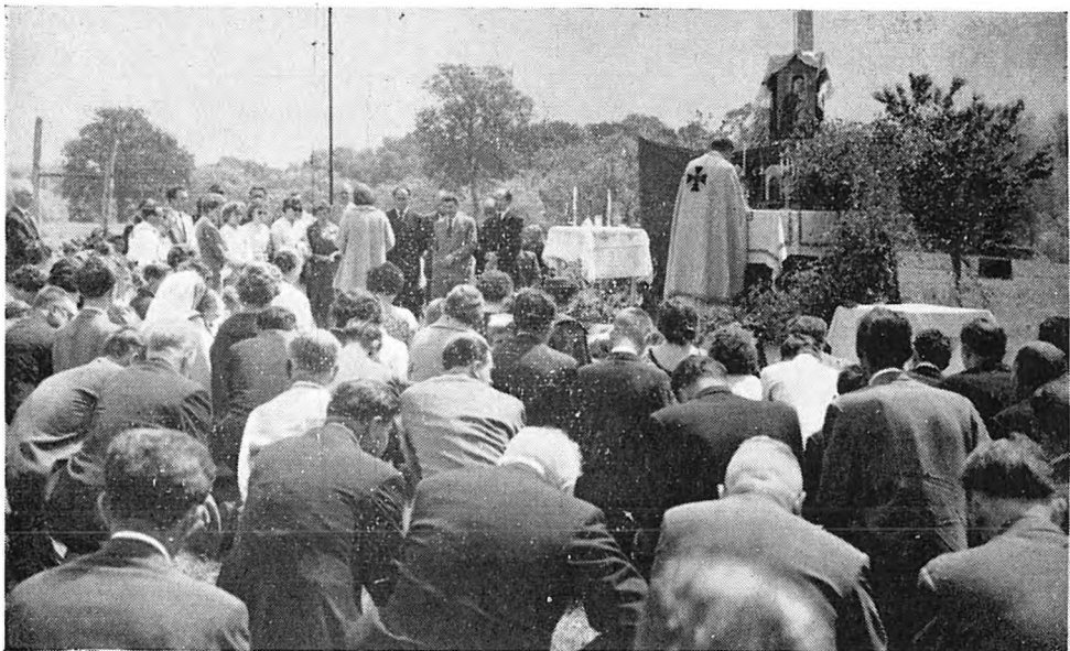
Польова Служба Божа