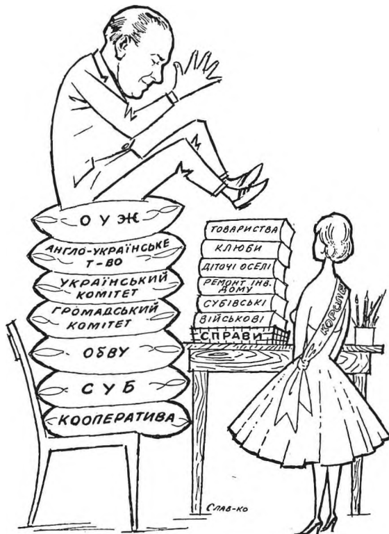
Пробачте, не можу злізти.