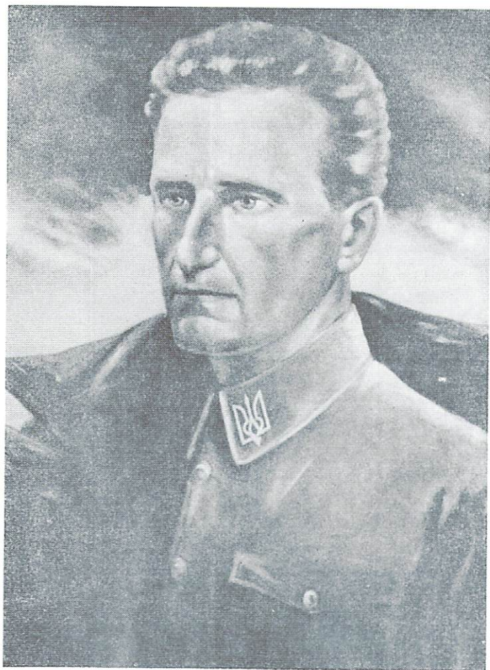
ROMAN SHUJEVYCH (1907—1950) COMANDANTE EN JEFE DEL EJERCITO DE LIBERACION UCRANIO Y JEFE DE LA ORGANIZACION DE NACIONALISTAS UCRANIOS EN TERRITORIO PATRIO