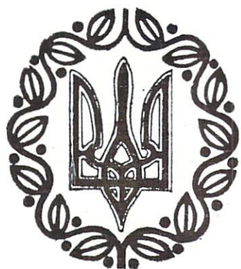
ESCUDO NACIONAL UCRANIO