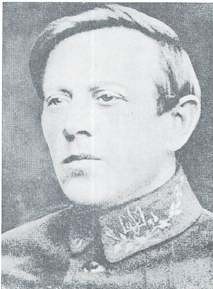
SIMON PETLURA (1879—1926) PRESIDENTE DE LA REPUBLICA NACIONAL UCRANIA Y COMANDANTE EN JEFE DE SUS FUERZAS ARMADAS