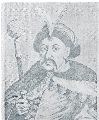
BOHDAN JMELNYTSKY (1648—1657) FUNDADOR Y GOBERNANTE DEL ESTADO COSACO UCRANIO