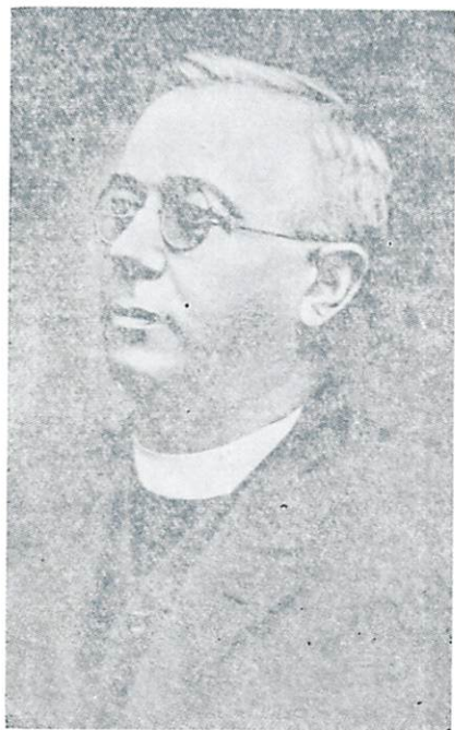
AUGUSTIN VOLOSHYN (1874—1946) PRESIDENTE DEL ESTADO DE LA UCRANIA CARPATICA