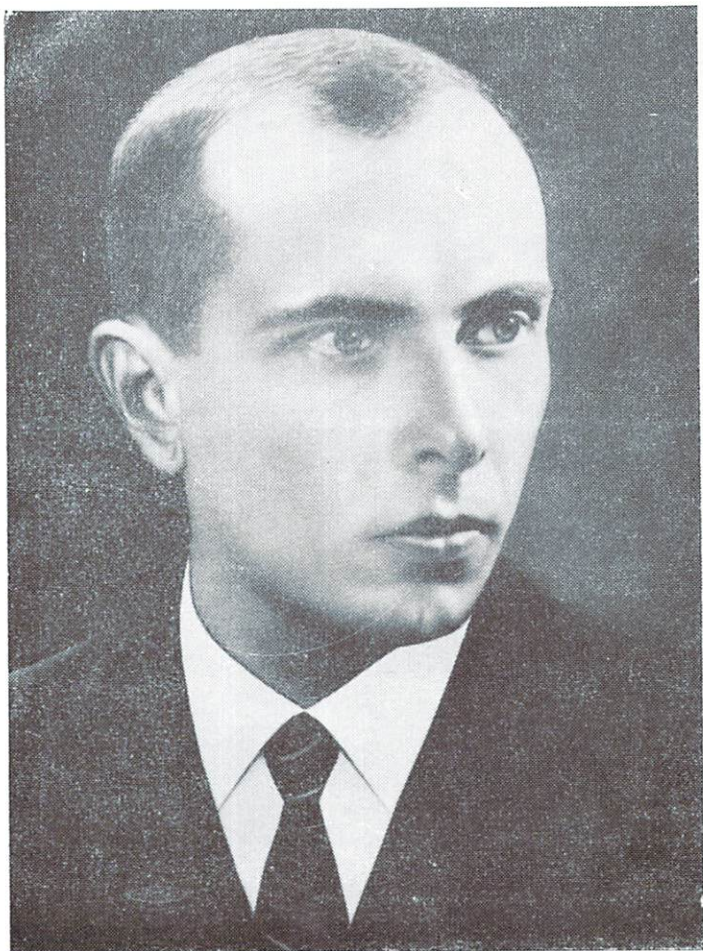
STEPAN BANDERA (1909—1959) JEFE DE LA ORGANIZACION DE NACIONALISTAS UCRANIOS Y SIMBOLO DE LA LUCHA REVOLUCIONARIA PRO LIBERACION