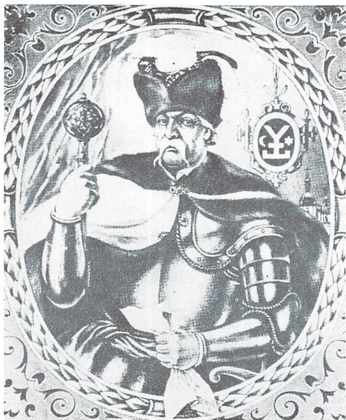
IVAN MAZEPA GRAN GOBERNANTE DEL ESTADO COSACO UCRANIO QUIEN CIFRABA SU AMBICION EN UNIFICAR A UCRANIA Y ASEGURAR SU INDEPENDENCIA