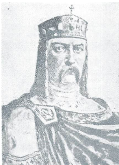
EL REY VOLODYMUR EL GRANDE (980—1015) ESTABILIZADOR DE LA FUERZA Y DEL PODERIO DEL PRIMER ESTADO MEDIEVAL UCRANIO