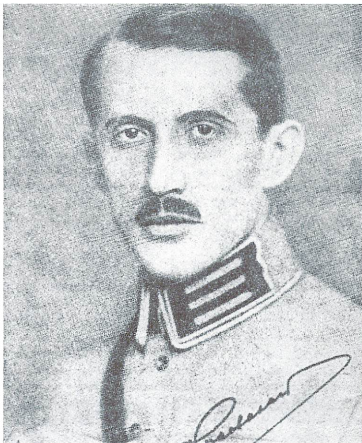
EUGEN KONOVALETS (1891—1938) PRIMER JEFE DE LA ORGANIZACION DE NACIONALISTAS UCRANIOS (MOVIMIENTO REVOLUCIONARIO UCRANIO PRO LIBERACION)