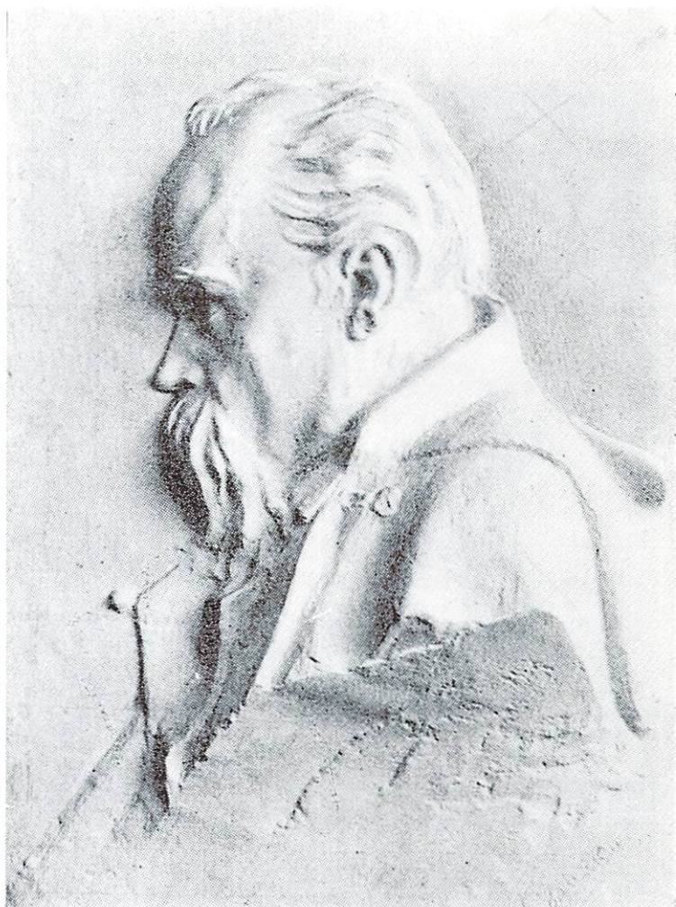
TARAS SHEVCHENKO (1814—1861) EL MAS EMINENTE POETA DE UCRANIA