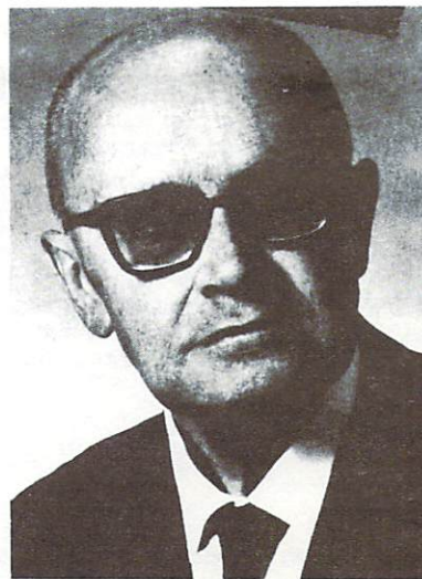
проф. Володимир Кубійович

Сердечно вітаємо нашого нового почесного члена та бажаємо йому дальшої насаги до наукової праці над завершенням гаслової Енциклопедії Українознавства та подібної в англійському перекладі.