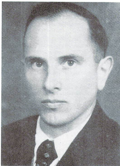
Степан БАНДЕРА * 1. І. 1910 — † 15. X. 1959 Крайовий Провідник ОУН 1932-34 Голова Проводу ОУН 1940-1959