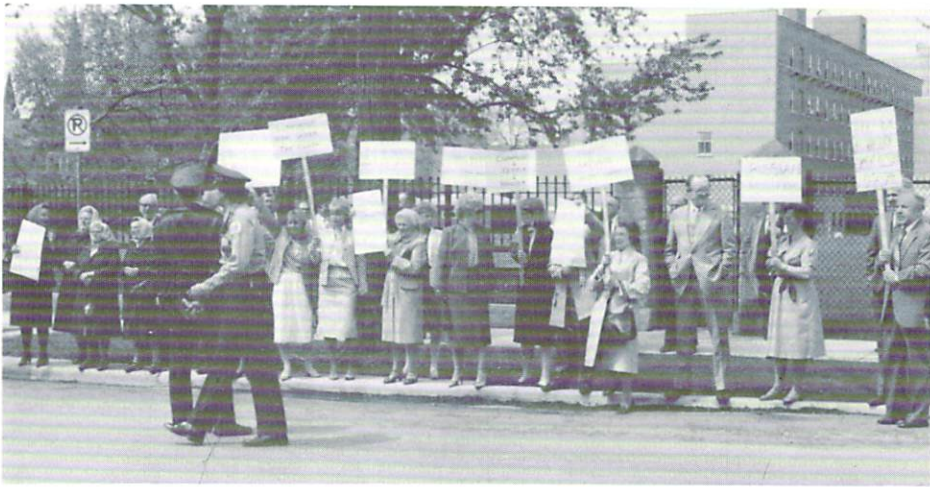
Пікетування комуно-московських церковників, емісарів режимного патріарха Пімена, при Російській Православній Катедрі в Чикаго, вул. Левітт-Дівіжен, дня 13. травня 1984 р.

Саме для придбання так важливих фінансових засобів ми відбули доволі успішний літній „пікнік” нашої організаційної клітини, а в грудні 1983 р. урочистий «Вечір АБН» для відзначення 40-річчя його існування, як також наша доволі велика репрезентація взяла участь в крайовім відзначенні тієї річниці в Детройті.