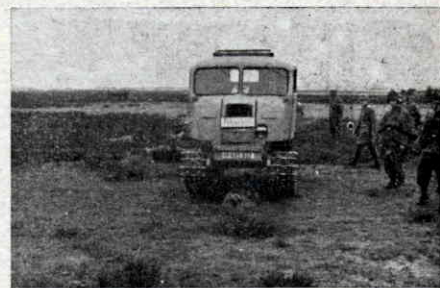
Вправи протипанцирних стрільців

Розмістивши вояцтво на кількох хуторах, я наві'язав зв'язок зі штабом німецького командування місцевого фронтового відтинку. Це був молодий німецький полковник; ми разом простудіювали на карті ситуацію. Від нього ж я довідався, що село Скварява, яке загорджує нам дорогу з оточен-