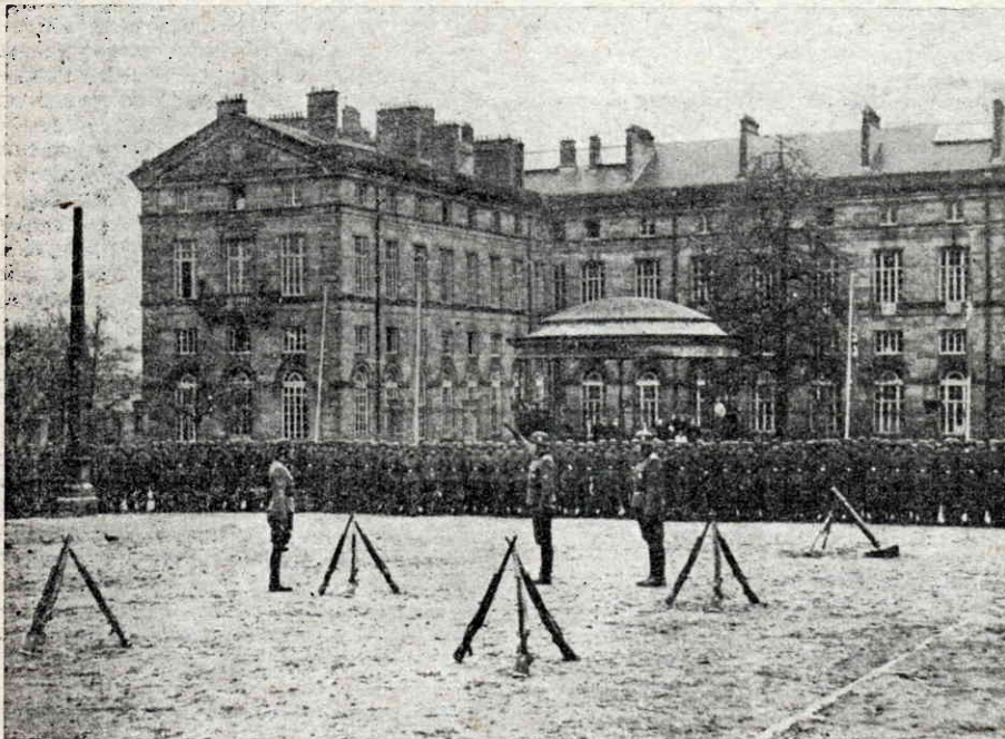
Присяга частини 1 УД