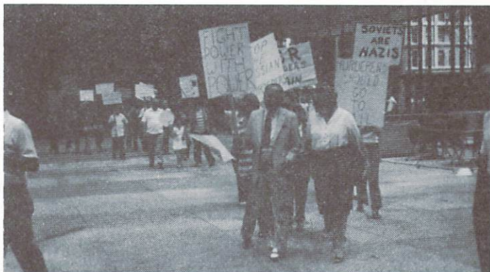
З демонстрацій на Дейлі Пляжа в Чикаго з приводу зістрілення Кореанського літака - 5.IX.1983 р.

Повстанське військо непоборне Дійшло в боях над Море Чорне, Й отаман Щух поніс братам Нові, святі кличі дружинні: — Народам воля і людині, Героям слава і борцям!