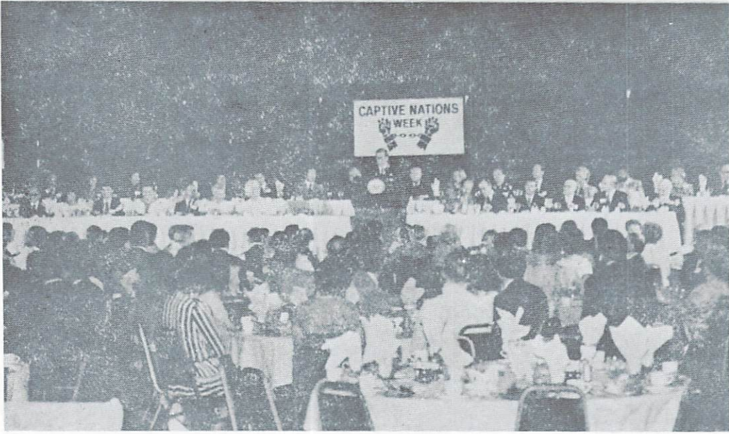
З бенкету 25-річчя Тижня Поневоленних Народів і 40-річчя АБН в готелі «Гренд Гаст Редженсі» у Вашингтоні, 18. VII. 1983 р.

■ 12/ XVI-та Конференція ВАКЛ відбулася в днях 19-22 вересня 1983 в Люксембургу, при участі 400 делегатів зі 118 країн. Українська делегація була складена з 10 осіб. — Були схвалені м.і. резолюції до теми 40-річчя АБН і до проєкту звільнення за списком АБН 269 сов. політв'язнів, як відплату за жертви Кореанського літака. . . . — Господарем конференції офіційно була Бельгія. — Господарем XVII-ої Конференції ВАКЛ в 1984 р. буде Америка, — Амер. Рада Світ. Свободи.