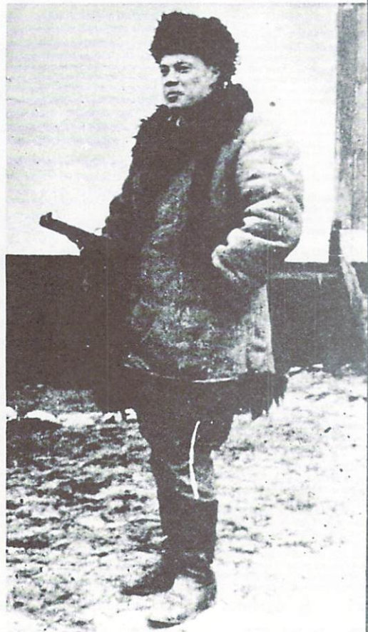
Ростислав Волошин /Павленко/, провідний член ОУН, визначний політичний діяч й організатор УПА на Волині, - Голова Першої Конференції Поневоленних Народів Сх. Європи й Азії 1943 р.