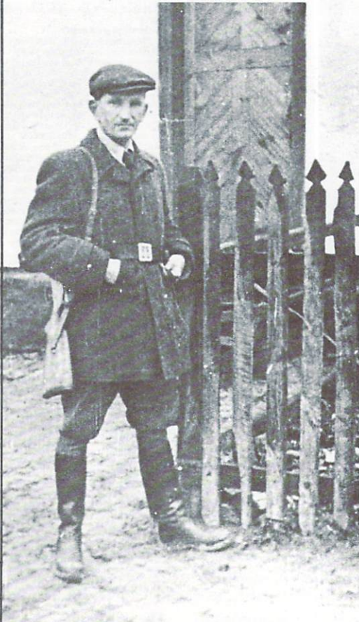
Ген. Роман Шухевич /Тарас Чупринка/, голова проводу Воюючої України, Головний Командир УПА - спонзор й організатор Першої Конференції Поневоленних Народів Східньої Європи й Азії. /Знімка з 1947 р./