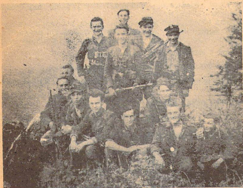
ВІДДІЛ УПА В РЕЙДІ НА СЛОВАЧЧИНІ

6. УГВР змагає до порозуміння і прагне мирного співжиття з усіма сусідами України на принципі взаємного права на власні держави на етнографічних землях кожного народу.