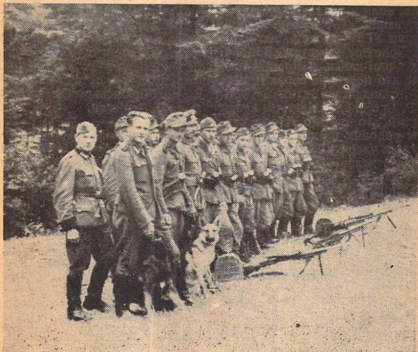
ВІДДІЛ УПА, ЯКИЙ ОХОРОНЯВ 1-ий ВЕЛИКИЙ ЗБІР УГВР ПЕРЕД МОЖЛИВИМ НАСКОКОМ НІМЦІВ, АБО БОЛЬШЕВІЦЬКИХ ПАРТИЗАН.

Особливо яскравою і могутньою маніфестацією єдності українського народу на Українських Землях з УГВР є цілковитий бойкот т. зв.