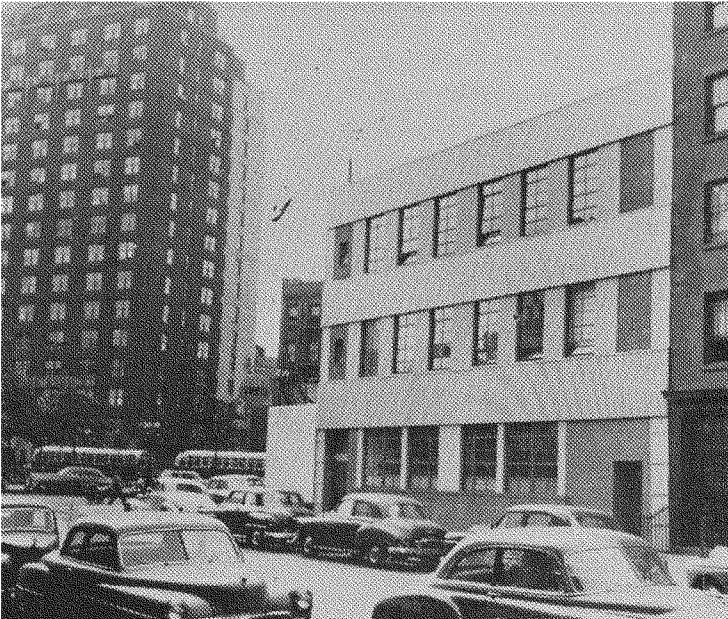
Дім НТШ в Нью Йорку.

SHEVCHENKO SCIENTIFIC SOCIETY, INC. НАУКОВЕ ТОВАРИСТВО ІМ. ШЕВЧЕНКА В ЗДА 302-304 WEST 13 TH STREET, NEW YORK 14, N.Y.