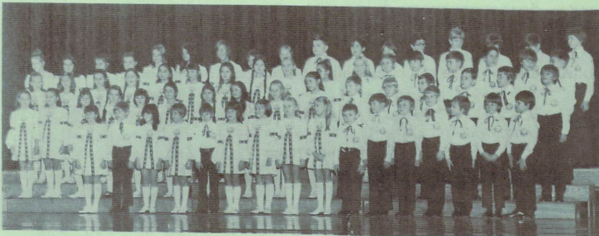
Хор „Молодої Думки“

Це було щось свіже, цікаве і корисне, коли Управа нью-йоркської „Думки“ запросила 18 листопада ц. р. представників преси й декого з мистецько-музичного світу на інформаційну зустріч до Народнього Дому. Йде тут про нові організаційні плани хору „Думка“, що могли б — бодай частинно — розворушити оспалість і збайдужіння нашого громадянства в хоровій ділянці в ЗСА й Канаді. Точніше, діло тут у реорганізації „Молодої Думки“ в напрямі збільшення і скріплення чисельності членів, а тим самим голосистості хору.