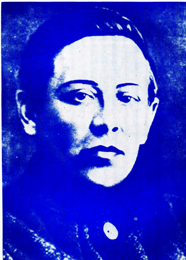
Симон Петлюра, Голова Уряду й Головний Отаман Військ Української Народньої Республіки.