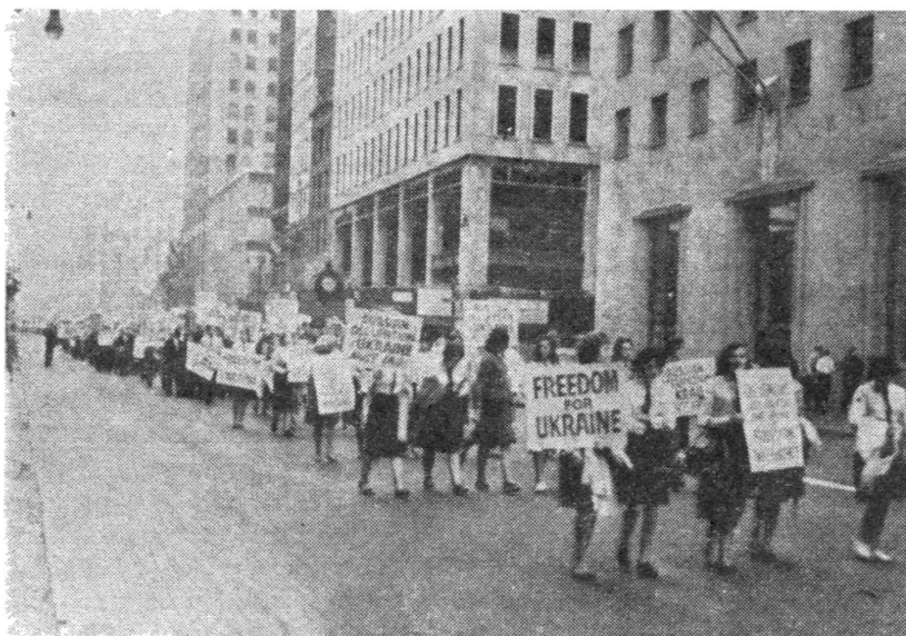
Українці м. Нью-Йорку демонструють проти Хрущова під час 15-ої Сесії Об'єднаних Націй.

13. Але ми українці, американські громадяни, з прикрістю стверджуємо, що наша могутня держава США, на яку звернені очі всіх поневолених народів, як на оборонця волі і справедливости, не спромоглися взяти ініціативи в свої руки в поході проти російського колоніалізму, зокрема в питанні поневолених Росією неросійських народів. Навпа-