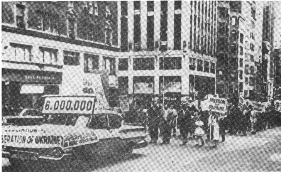
Авто СВУ з трансфарентами на протихрущовській маніфестації в Нью-Йорку, що відбулася у минулому році.