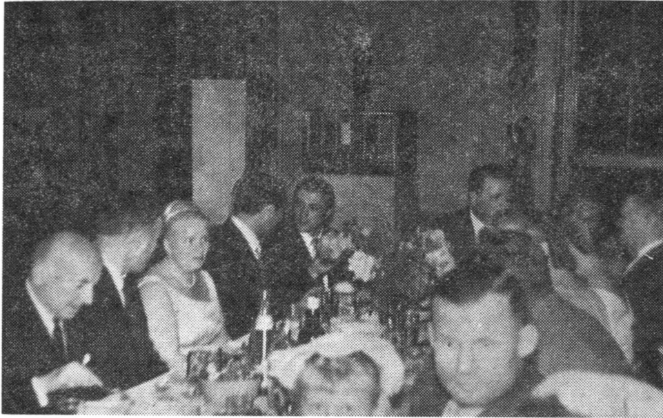
Група представників не-російських народів на Бенкеті Асоціації бувших політ'язнів під советами, що відбувся в Нью-Йорку 11 червня цього року.