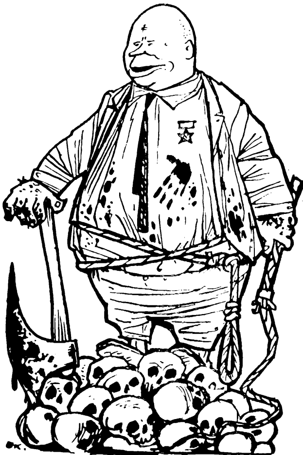
"Butcher of the Ukraine"

Очевидно, що найбільшу "увагу" в цьому відьомському кодлі приділено Хрущову. Сьогодні американці зустрічають його не з зацікавленням, як рік тому, а з прокльонами, кпинами й висміюванням та відвертим наказом покинути територію США. Вони не можуть йому простити погроз "збури США" та паплюження Президента Айзенгавера. І треба признати, що американські демонстранти не скупляться на міцні вислови в сторону диктатора, як на приклад: "Пошукуємо вбивника — товстого червоного пацюка". Приїзд комуністичних терористів на сесію ОН, американська преса порівнює до розконспірованого у США, рік тому, збіговища гангстерів в Апалачін, але там, пишуть газети, були порушники законности, а комуністи