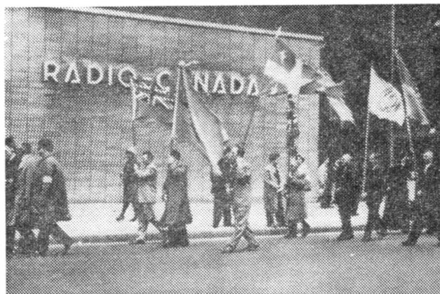
Члени СВУ в Монреалі з новопосвяченим прапором Осередка демонструють проти висвітлення через телевізію фільма скерованого проти сл. п. Голови Української Держави Симона Петлюри.