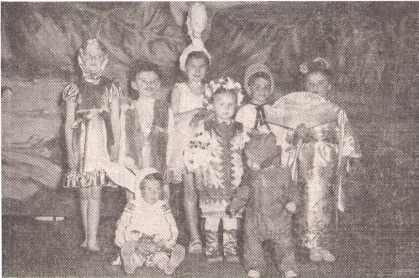
Наші найменші новачки на костюмовім балі у Вінніпегу.