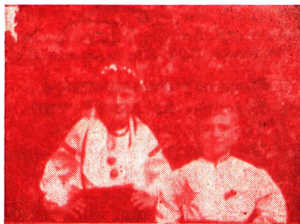
Білики зі Сенді Лейк, Ман.

Так я завжди буду жити, Буду рідний край любити, Українцям помагати, Бо Вкраїна — моя мати!