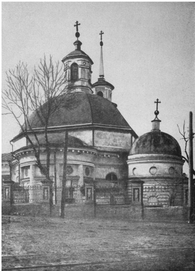
Церковь Рождества Христова.

Сооружена в 1810-14 гг. архит. А. Меленским, разрушена в 1934 году.