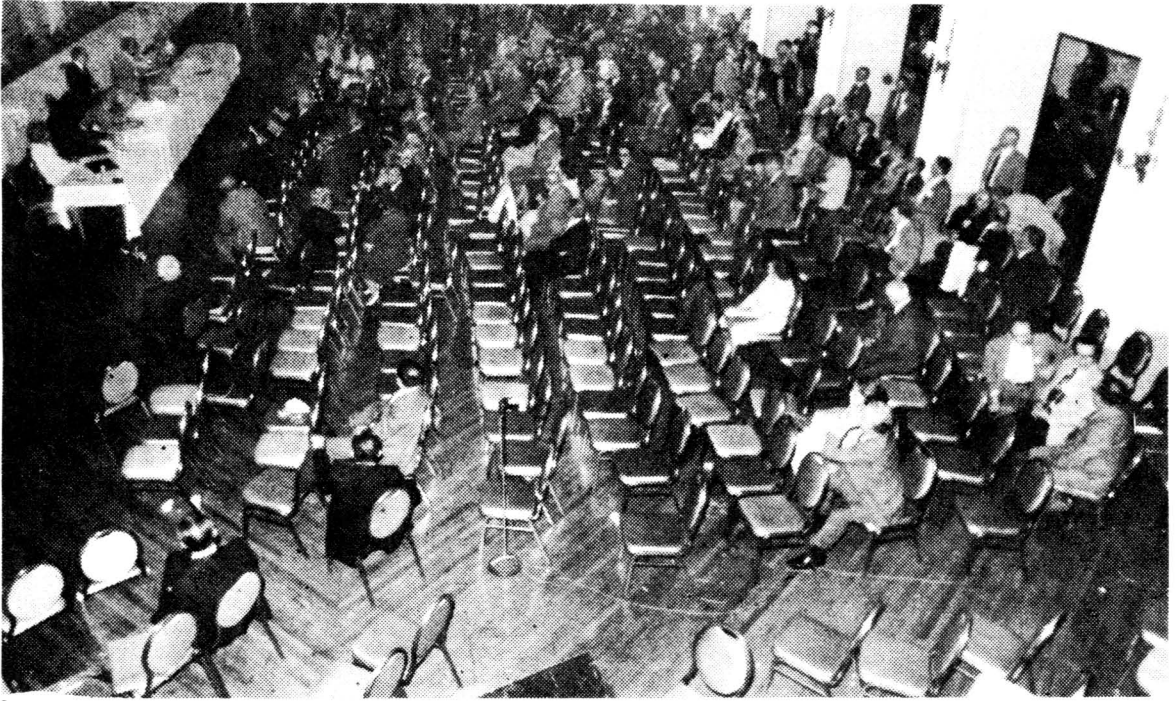
View of the concluding session of the congress after delegates of over 20 organizations walked out.