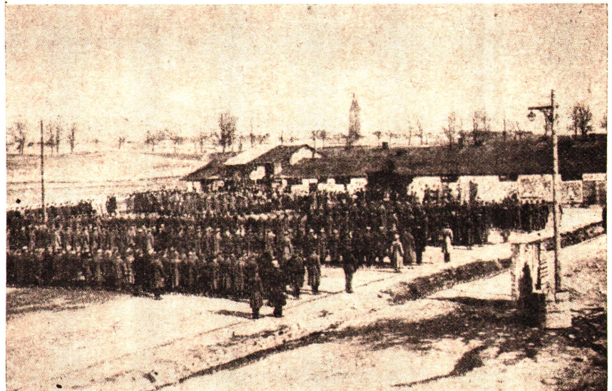
Баракки в Йозефові, в якому був приміщений Курінь УГА. Стрільці готуються до вимаршу на Сл. Божу ізза протесту проти рішення Антанти з дня 14. 3. 1923.

Наші СС-и завинили на цілій лінії — і Гетьмана не підтримали і з поміччю до нас не прийшли. А вже коли большевики користаючи з нашої незгоди посунули на Україну по поваленні гетьманату, ситуація стала для нас безнадійною так на Великій Україні як в Галичині, коли ми були здані на власні сили. Зате до Львова з польської сторони надходили щораз нові