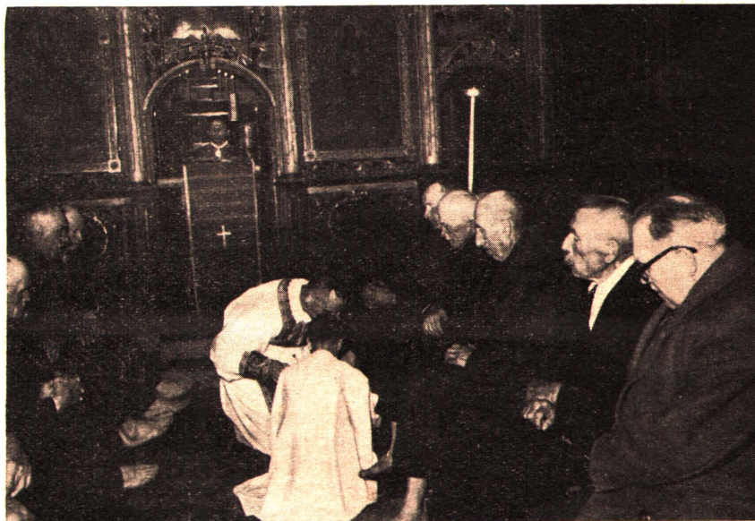
Великдень в Руському Керестурі. Умивання ніг старшим громадянам в Страстний Четвер 1962 р.

По одногодинній їзді ми опинилися в Куцурі, дуже великому селі, з двома церквами, де душпастирює двоє священників. Один з них парох о. Міклош Юра, а другий його сотрудник о. Кирило Мудрий. Він батьком численної сім'ї, в тому 6 синів, з котрих є двоє богословів. Зустріти так многочисленну родину пригадало мені наші священничі дома в Галичині, що постачали нам чималі кадри інтелігенції. Тільки тут нема доступу для ліберально думаючих, як то