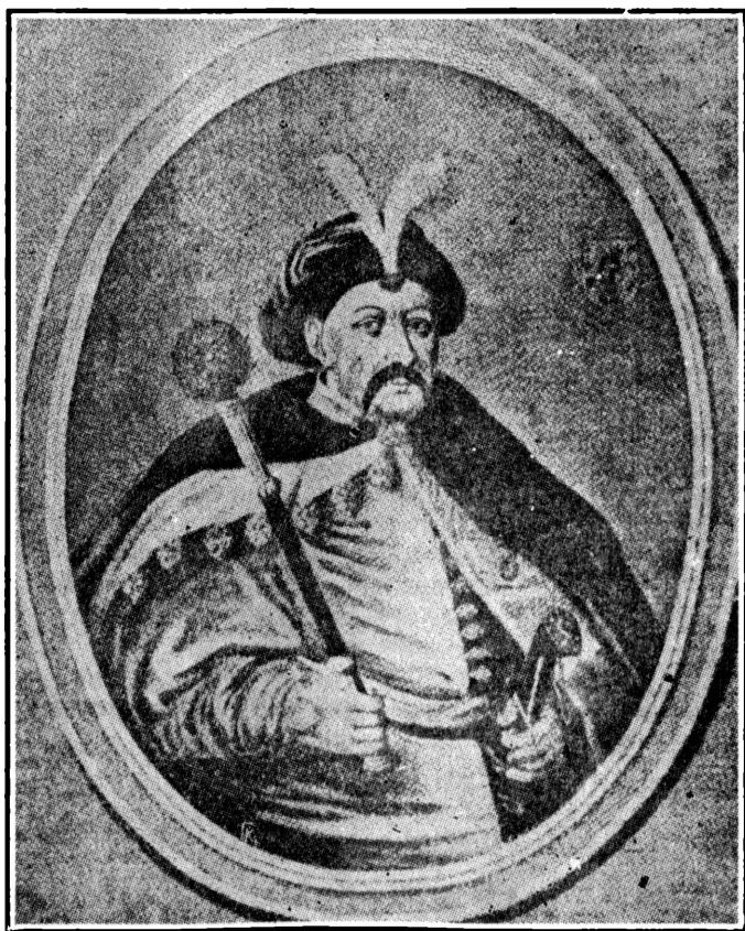
Богдан Хмельницький, — портрет його, як був гетьманом. надрукований в 1651 р. в Гданську (Данцігу).