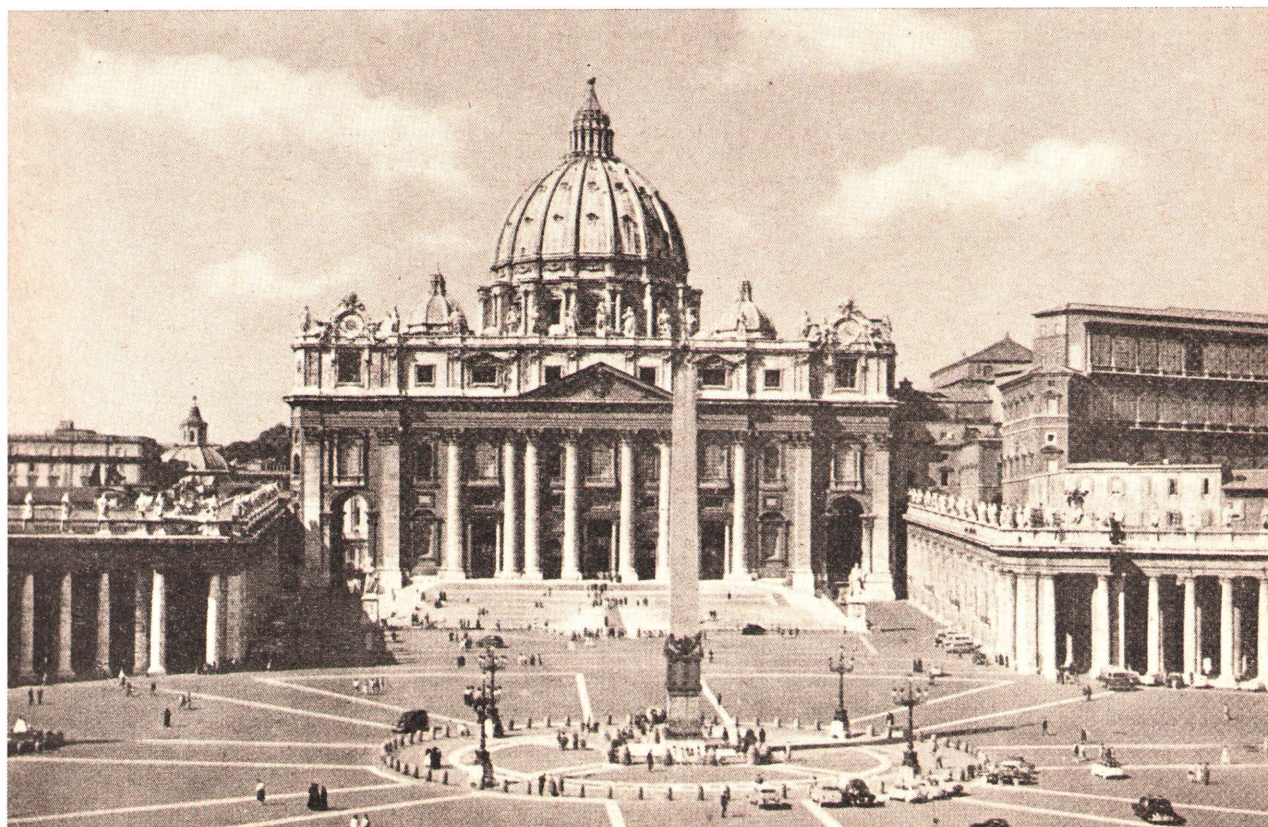
ВАТИКАН — РИМ. ХРАМ І ПЛОЩА СВ. ПЕТРА.

ВІТАЄМО СОБОРОВИХ ОЦІВ І УЧАСНИКІВ ВСЕЛЕНЬКОГО ІІ. ВАТИКАНСЬКОГО СОБОРУ, зібраних на 4-ій сесії в дні 14. вересня 1965.