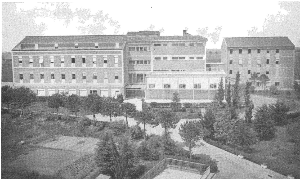
Монастир Отців Салезіян в Римі і Мала Духовна Семінарія.

На адресу Заряду Віцепровінції наспіли численні гратуляції. Тому Редакція «Українських Християнських Вістей» до них приєднується і від себе шле щонайщирші побажання Господніх ласк з Висоти та найкращих успіхів в тій так хосенній праці для українського народу. Щастя Боже!