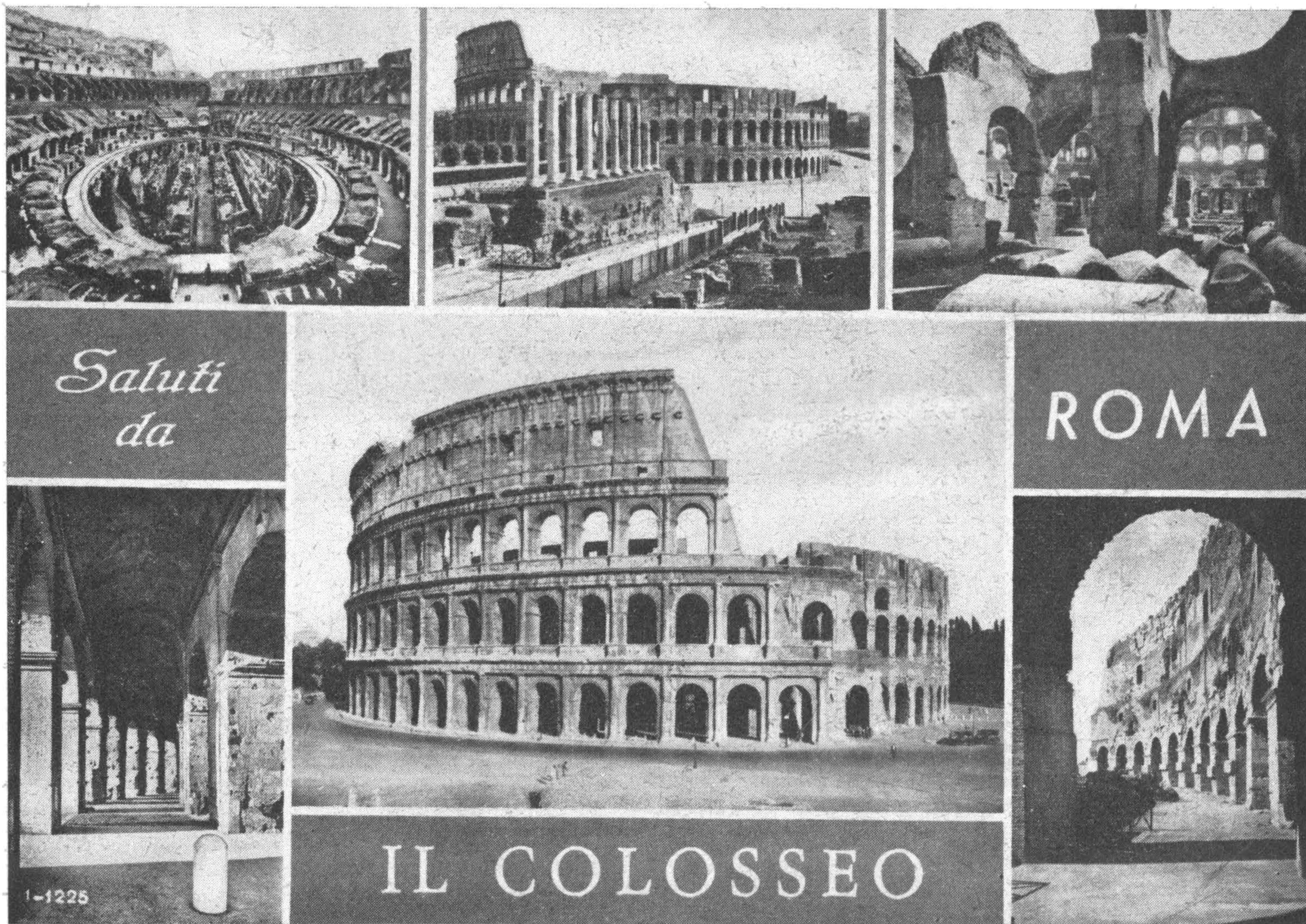
Римський цирк Колізей, де гинули за віру перші християни.

Непроглядні маси, що звернені в сторону храму св. Петра. А з правого боку Ватикану виходять Владика в ясно сніжних фелонах. Одна краса! Слідкуємо і бачимо українських (гр. католицьких) владик в не менше чудових ризах, світлих як сонце Боже ясне! Всі йдуть повагом. Дивимося і не можемо очей від-