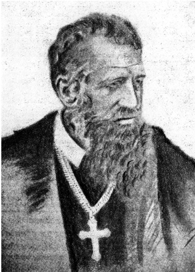
Митрополит Галицький Кир Андрей Шептицький

хипастирства відбув прощу до св. Землі, щоб на святих місцях пробування Христа зачерпнути творчих сил до відповідальної праці. — Вернувши з прощеною віддається з цілою силою повіреній пастві на релігійному, культурному і політичному полі. Стає меценатом і фундатором інституцій та шкіл і того всего, що нам не перелічити. Врешті основує Національний Музей, де зберігати муться пам'ятки давньо-миного! Могутнім голосом промовляє в соймі і віденським парламенти за основиання українського університету у Львові. Стає добродієм вбогих и немічних! Врешті фундує лікарню на вулиці Скарги! Пособляє мистецтву і висилає спосібних адептів на студії за