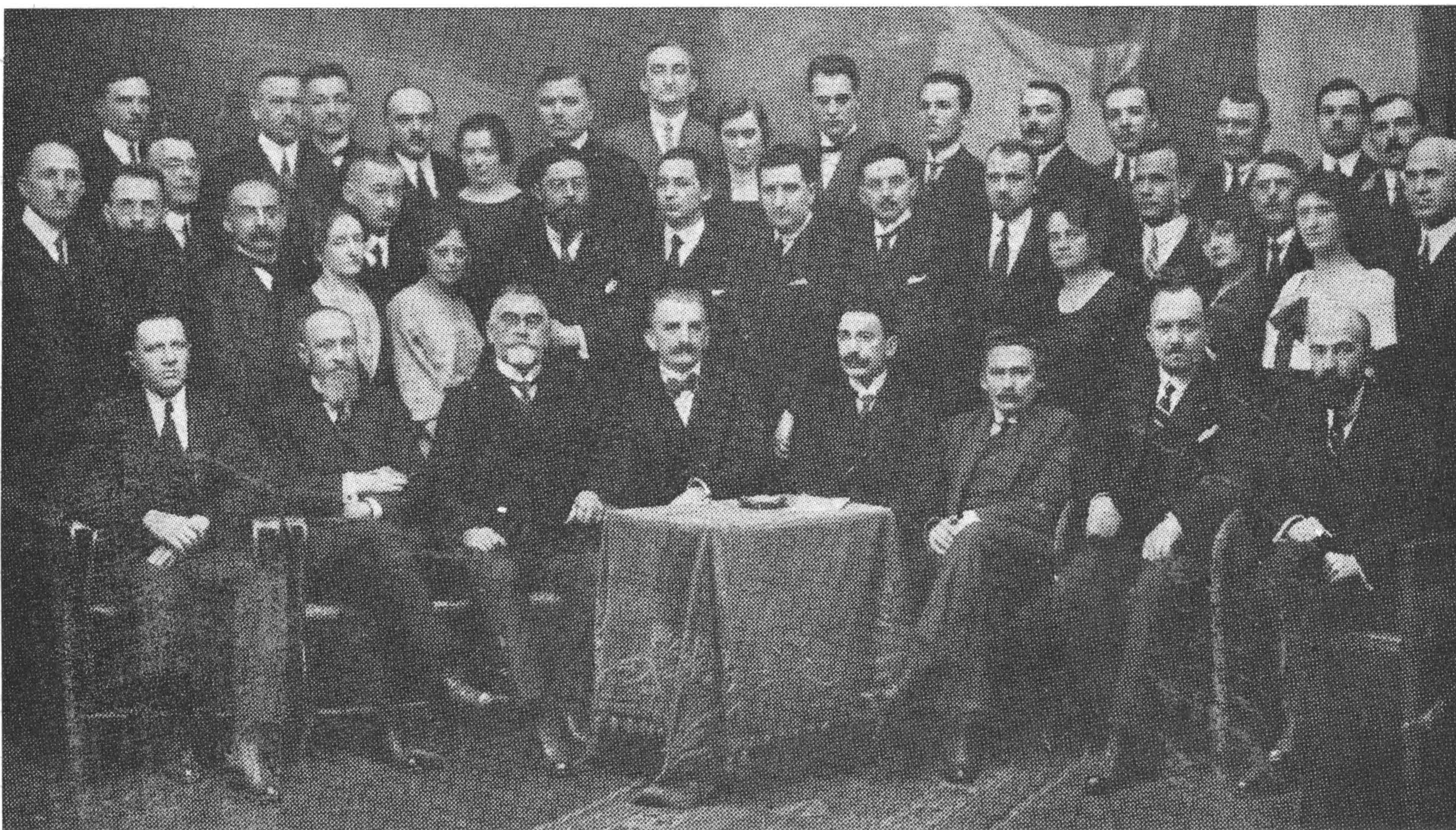
Президент Західньо-Української Народної Республіки Д-р Євген Петрушевич зі своїм Урядом на еміграції у Відні в 1920 році.

Родинною стороною пок. Диктатора д-ра Євгена Петрушевича була колишня волость дулібів-бужан над верхнім Бугом з осередком у Бужську, де й народився покійний. В часі княжих міжусобиць та во-