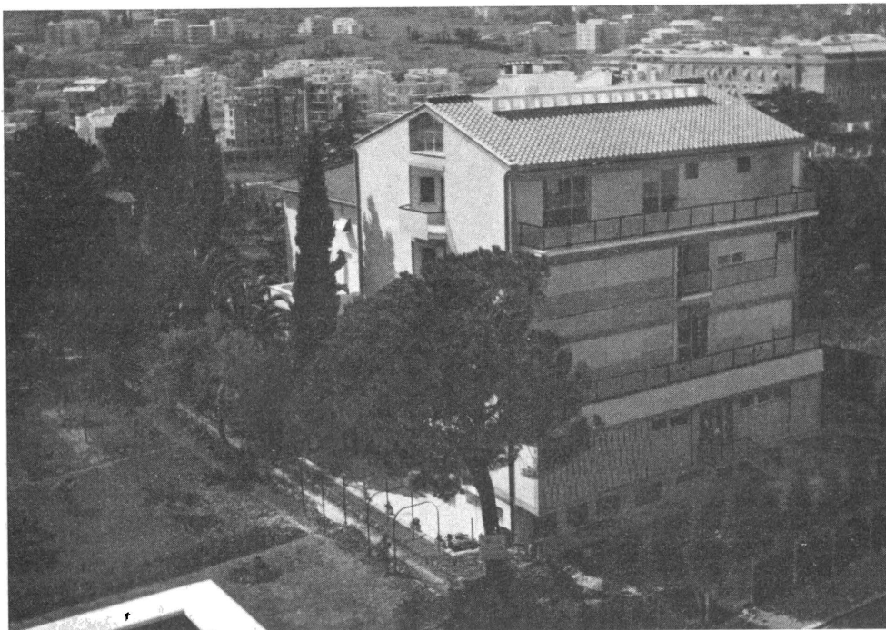
Дім Згромадження Сестер Служебниць Пресвятої Непорочної Діви Марії.