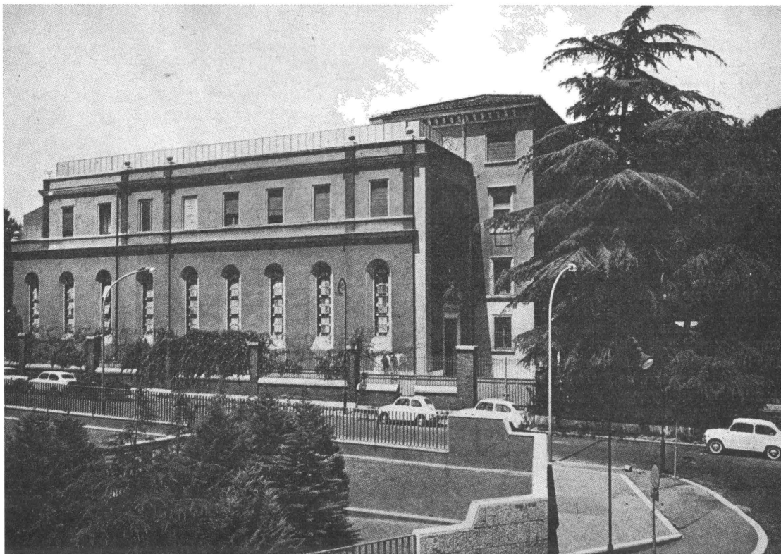
Обитель ОО. Василян в Римі на Авентині.

Під сучасну пору Рим є осідком слідуєчих наших чинів і інституцій.