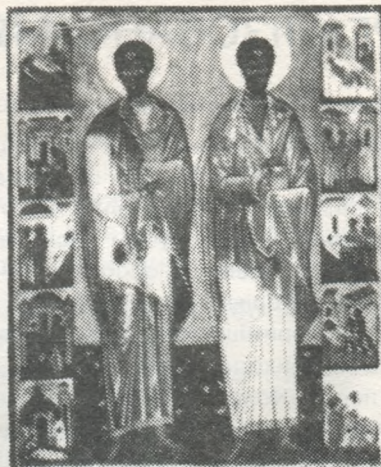
Св. Косма і Дам'ян, ікона з XVI-го сторіччя з української церкви в Яблониці, біля Березова.

ла різьба в дереві, (барельєф) "Мати Божа", що походила з церкви в Загір'ї під Сяноком.