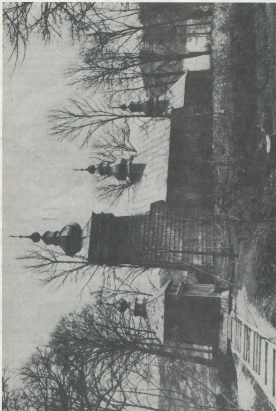
Нове Село, Польща. Українська греко-кат. церква (збуд. 1795 р.), спалена в 1975 році. Вид від південної сторони.

Published by THE LEMKO RESEARCH FOUNDATION, Inc.; Box 651 Cooper Station New York, N.Y. 10276