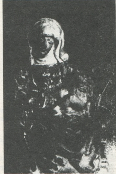
Ікона Пречистої Діви Марії, забрана до Музею в Сяноці. Ікона мальована на дошці.

броді. Збірка кованих ратищ, стріл та черепків з недосліджених руїн X-XIV ст. — в Мимоні. Численна збірка (38 штук) попільниць, найдених в селі Ходорівка біля Динова, означена археологом на XVIII ст. до нашої ери. У попільницях знаходились вироби з бронзу, як браслети, фібулі та один перстень.