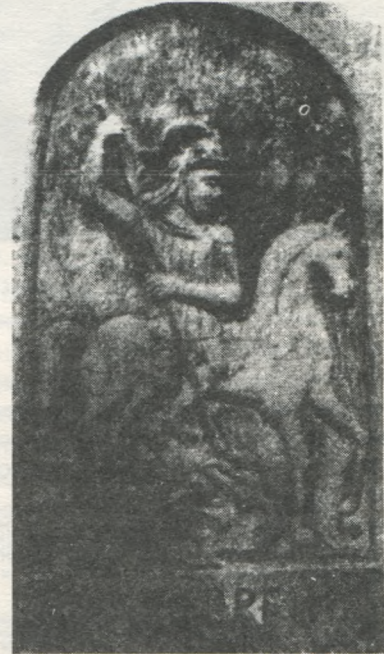
Св. Юрій Переможець; ікона великої мистецької вартості з XV сторіччя.

З кам'яних різьб на цоколях пам'ятників різьблено, крім поданих мотивів, княгиню Ольгу, архианге-