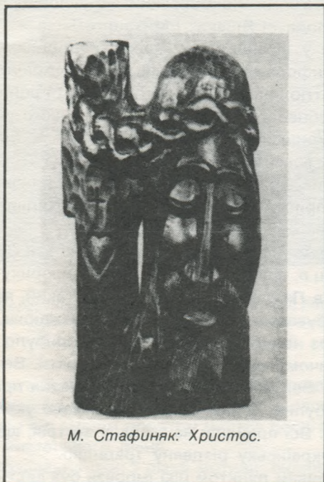
М. Стафняк: Христос.

ради. Кругом поважні, сумні обличчя. Невимовний жаль рвав душу на шматки цим, загартованим в боях, воякам УПА. Стільки зусиль, стільки жертв і який же вислід?!