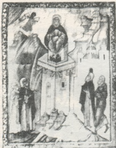
Св. Симеон Стовпник; ікона з XVI-го сторіччя з української церкви в Костарівцях, біля Сянока.