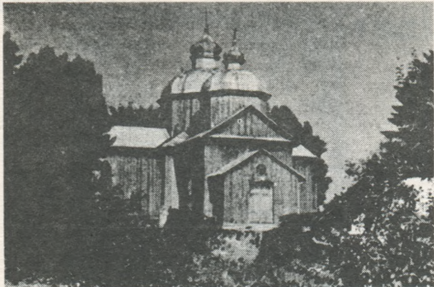
Село Юрівці, саницького повіту. Дерев'яна церква св. Юрія, збуд. в 1873 році.

бути, в залежності від здібностей майстра-різьбара, або надзвичайно примітивні і вражають своєю наївністю, або під вмілим долотом мистця досягають високого мистецького рівня.