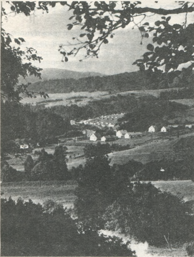
Вид на село Довжиці, біля Тісної.

Цікавість огортає всіх — які відносини, що за люди, як нас приймуть?... Та думаємо, що зараз кожний зуміє відповісти собі на ці питання.