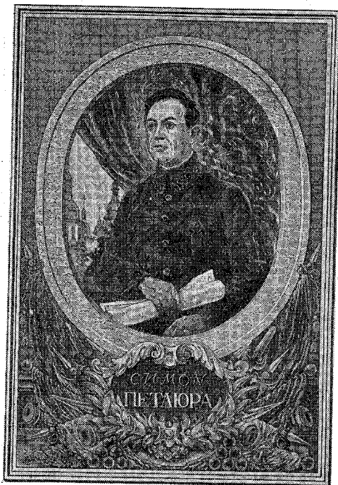
ПОРТРЕТ ПРАЦІ проф. В. МАСЮТИНА

С ИМОН ПЕТЛЮРА зайняв в українській історії місце нарівні з великим нашим Гетьманом Іваном Мазепою, як Вождь народу й верховний комендант Української Армії у збройній боротьбі України з одвічним своїм ворогом Московщиною. За його заслуги перед Рідним Краєм вшановують його пам'ять українці щорічно в день його трагічної загибелі від руки підступного вбивці, підісланого ворогами України.