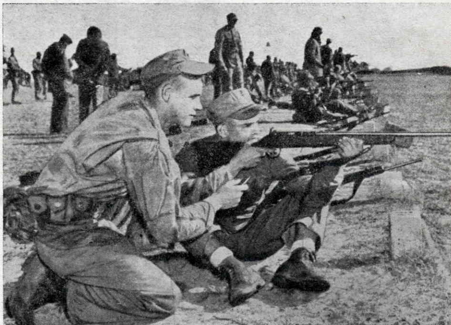
Рекрути американської морської піхоти (marines) підчас стрілецького вишколу

Американський армійський кріс це прекрасна зброя, що надається однаковою мірою для бойового, як і для прецизного стрільня. Але вишкіл на стрільниці свідомо відсувається на задній плян. Боець мусить якнайшвидше навчитись володіти своєю зброєю в умовах поля бою. Сюди належить розпізнавання цілей вночі, оцінювання відстані за шелестами, за вистріловим полум'ям, як і ненацілюване швидне стрільня на близьку відстань. Загалом третину всього бойового вишколу перенесено на нічні години.