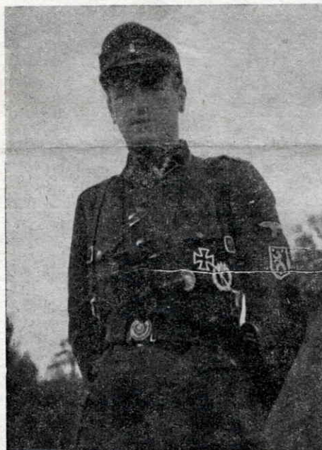
Старшина — фронтовик 1. УД на фронті під Фельдбахом

Але пригляньмося ближче. В першому випадку, коли юнак із своїми двадцятьма роками потрапляв до сотні, де сотенний мав 50 літ або й більше, він спершу старався робити все так, як його навчено в школі. Але вже на другий день звертав йому сотенний увагу, що не треба так гостро,