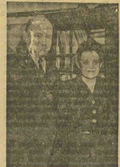
Кол. провідник польської селянської партії С. Міколайчик та його дружина.

Спека в Україні. Останнім часом в Україні триває сильна спека. Наприкінці минулого тижня температура на Правобережжі сягала до 27-33, а на Лівобережжі — 32-38 ступнів.