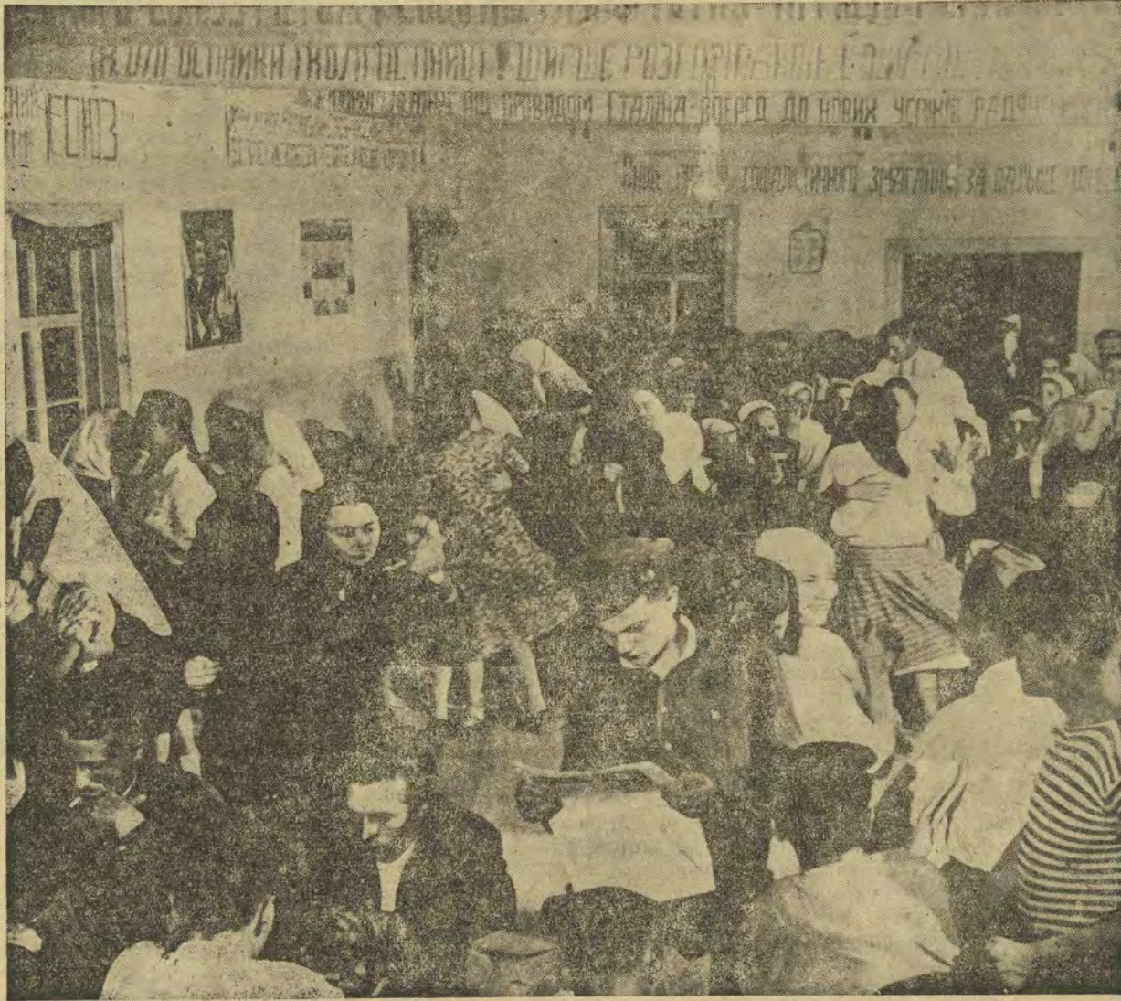
Україна. Сільський клуб. Попри всю виснажливу працю в колгоспі — люди все ж намагаються розважатись.