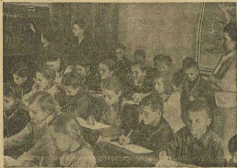
Українська школа в таборі Гренадир-Казерне, 1948 р.